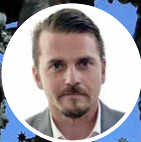
Jimmy Ståhl Riksdagsledamot