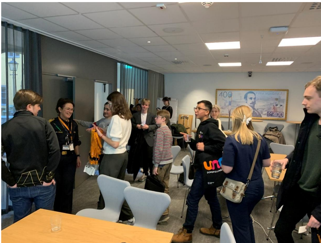
Dialog med polisen