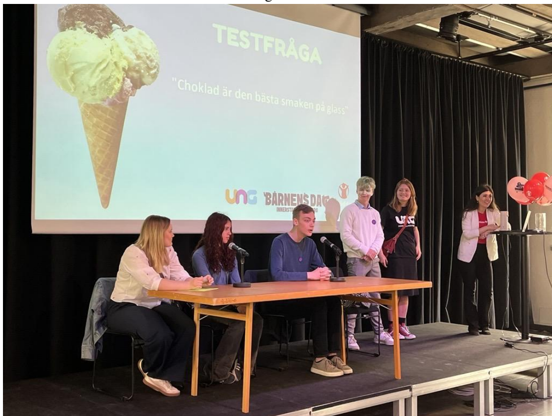
Barnens riksdag med Rädda Barnen