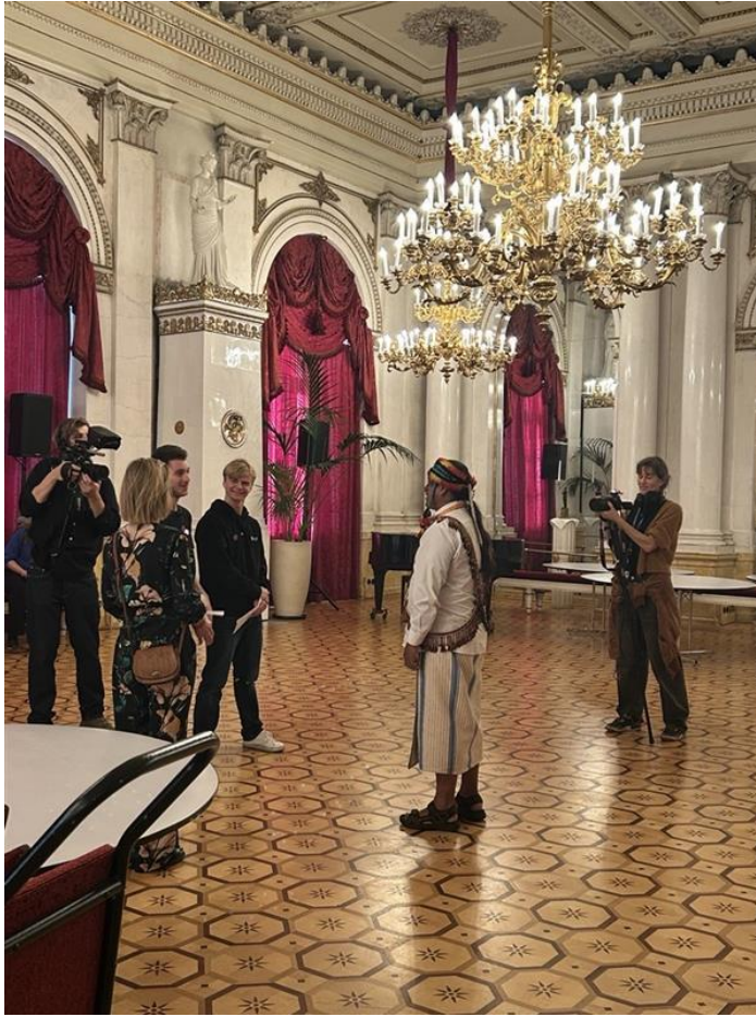
Ledamöter i UF intervjuar vinnare av WIN-WIN