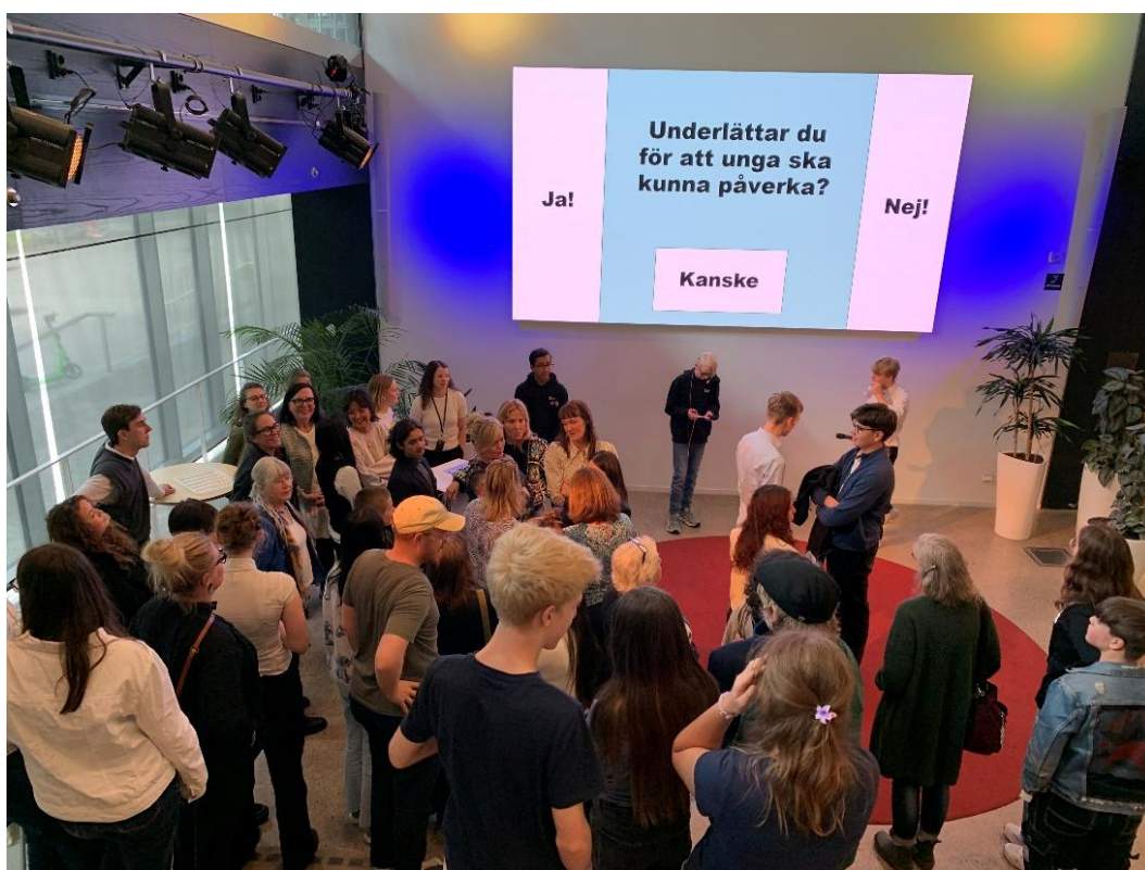
Dialog på trappscenen om hur ungas röster kan bli hörda på riktigt

kommunstyrelsen och stödjer utvecklingen och ungdomsfullmäktige. Ungdomsfullmäktige träffar den politiska referensgruppen regelbundet efter varje stormöte. Under 2025 genomfördes två dialogtillfällen tillsammans med referensgruppen – en om ungas delaktighet och ett om klimatet. Det första mötet hölls på stadsbibliotekets trappscen i maj, med temat hur ungas röster kan bli hörda på riktigt. Det var mycket folk på plats och agendan bestod bland annat av panelsamtal om elevråd, diskussion i bikupor, samtal med vuxenpolitiker, och fika. Det var UF-ledamöterna själva som höll i de olika programpunkterna och ledde de medverkande genom upplägget. Under samtal och diskussioner nämndes det bland annat att det bör vara en rutin att involvera unga, både bland förtroendevalda och i bolag. Det är också viktigt att unga får öva på att uttrycka sina åsikter och tankar.