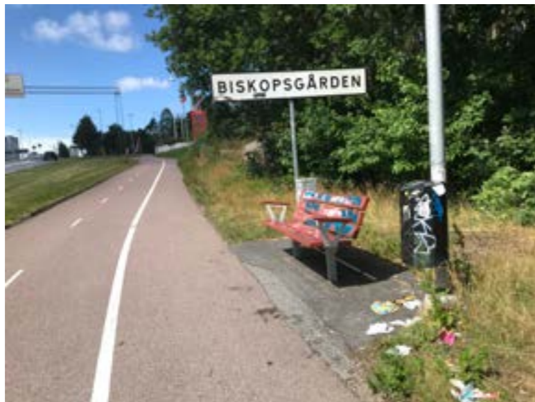
Rusta upp och få bukt med nedskräpningen i stadsdelen

”Se till att stadsdelen är fin och fräsch med fina lekplatser och få bort allt skräp. /.../ Skräpet ligger överallt, i skogsdungar, överallt. Mitt i naturen, på gårdar, gator och torg. Det sänder fel signaler. /.../ En ren och snygg stadsdel skapar trygghet och tillit. Det gör fina, hela fina lekplatser också. En fin yttre miljö är bra för hela stadsdelen och visar att man bryr sig och signalerar att vi som bor här är viktiga. Förslumningen ger motsatt känsla – och visar att ingen bryr sig. /.../ Rusta upp lekplatserna i Biskopsgården och anlägg fler lekplatser!” (Förening B2)