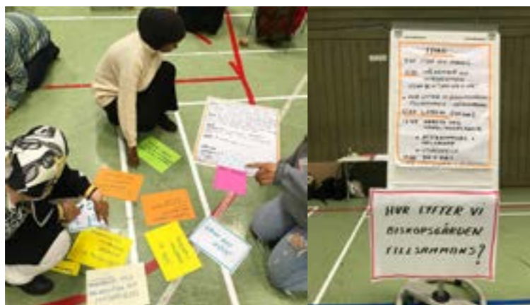
Workshop med föreningar i Biskopsgården.

”Vad som behövs för att föreningarna ska kunna bidra är ett sammankallande och koordinerande oberoende organ - det ska inte hänga på enskilda föreningar. Detta organ skall fungera som projektledare och se till att ideer omvandlas till handling. Det behövs också resurser (ekonomiska och i form av personer). Föreningarna i området är ofta redan korta om både pengar och resurser och behöver stöd för att orka jobba ytterligare ideellt. Det kan även krävas utökat ekonomiskt stöd till föreningarna för att kunna engagera fler resurser. Föreningarna i Biskopsgården kan bidra genom mer aktiviteter tex lov-aktiviteter och liknande. Att synas och höras mer så att det blir tydligt vilket utbud som finns i området.” (Förening E1)