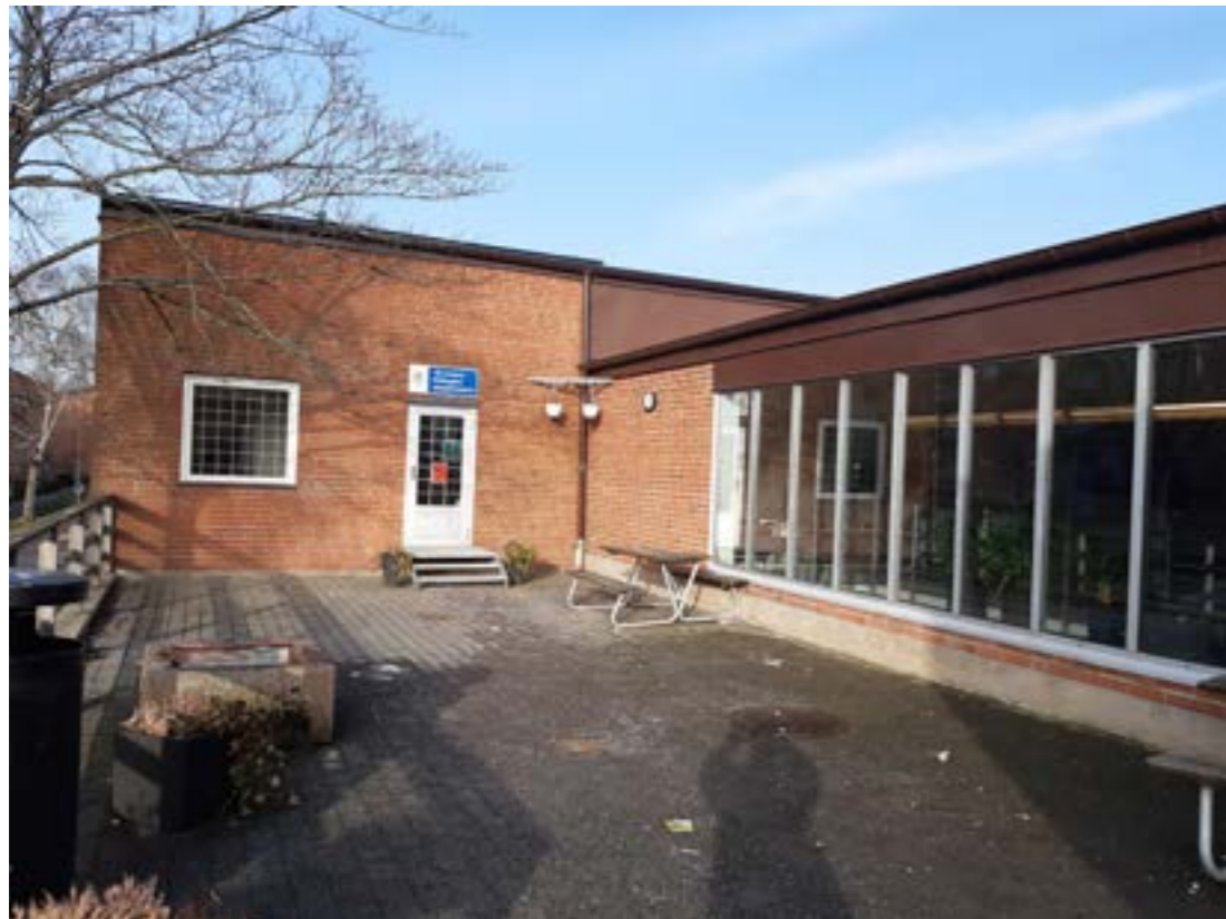
Vårvindens fritidsgård Länsmansgården, den enda fritidsgården i Biskopsgården

”Bättre fritidsgårdar och större fritidsgårdar, med mer personal på plats.” (Förening N3)