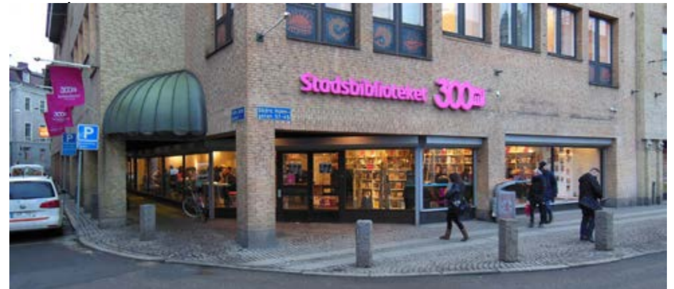
Det behövs ett barn- och ungdomsbibliotek vid Friskvåderstorget Foto på Stadsbiblioteket 300m2 i Brunnsparcken: Albin Olsson

Det behövs lokaler där föreningar kan ha möten och aktiviteter.