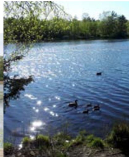
Naturområdet Svarte Mosse

Samtidigt uttrycks en djup oro över utvecklingen i stadsdelen, den ökade segregationen och känslan av otrygghet efter alla händelser på senare tid i området. Föräldrar är oroliga för sina barn.