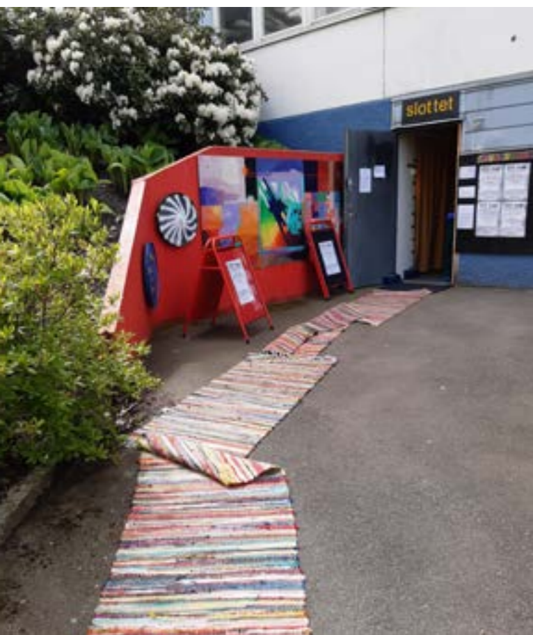
Meeting Plays kulturhus "Slottet" vid Friskvåderstorget - 50 m2 utan fönster, vatten eller toalett

”Ett kulturhus eller fritidsgårdar och mötesplatser gör att människor fångas upp och får känna sig delaktiga i sina närområden oavsett om det är för aktivitet det handlar om. Fånga upp ungdomars intressen och få dem att utvecklas i sina idéer eller åtaganden. Det finns en rastlöshet här och det beror dels på att det inte finns något att göra här i området. Vi behöver utveckla, bygga kulturhus och fritidsgårdar och mötesplatser att folk träffar andra och blir mer bekväm och trygg i sin bostadsområde...” (Förening G1)