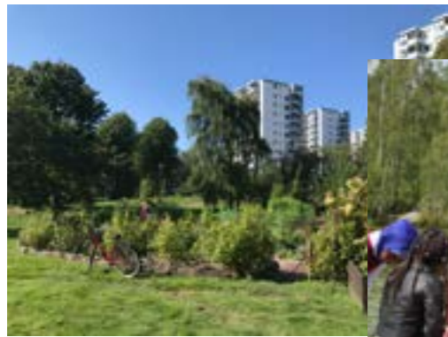
Odling i Värvedergatans fruktlund

“Fantastiskt att bo i den mångkulturella atmosfären, öppenhet, vänlighet, jämlik atmosfär. Trevliga grannkontakter. Enkelt, tillåtande atmosfär, vacker natur, bra kommunikationer, en känsla av att vara mitt i världen, geografiskt nära havet, bra basservice vad gäller mat, grönsaker, apotek, bibliotek, vårdcentral. Fina välordnade motionsspår och ett stort naturområde med skog och små sjöar.” (Förening R)