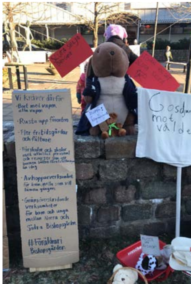
Nallemanifestation i Biskopsgården

”Flera saker. Synen på stadsdelen - många ser bara gängbråk och skjutningar och missar allt det fina som finns i närheten. Säkerheten - att kunna vara ute på kvällen efter skymning och inte känna en osäkerhet.” (Förening E2)