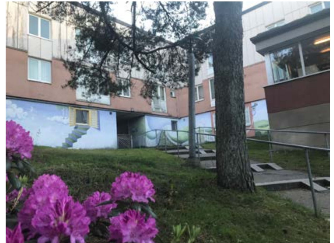
Klarvädersgatans muralmålning av konstnären Bengt Nordenborg, målad 1986 och lika fin än idag

Jobb till långtidsarbetslösa. Få bort känslan av varför dissas jag av samhället?” (Förening G1)