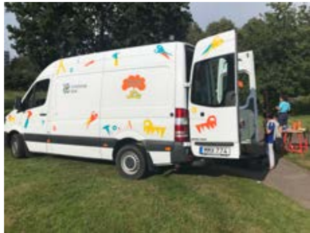
POP UP Bygglek på besök i fruktlund