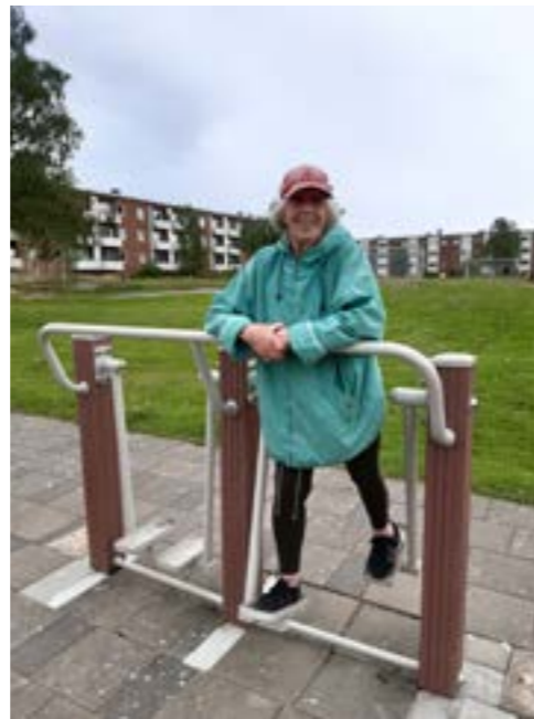
Träning på utegymmet på Rimfrostgatan

Det behövs fler organiserade fritidsaktiviteter för barn, ungdomar och familjer – aktiviteter som familjerna har råd med.