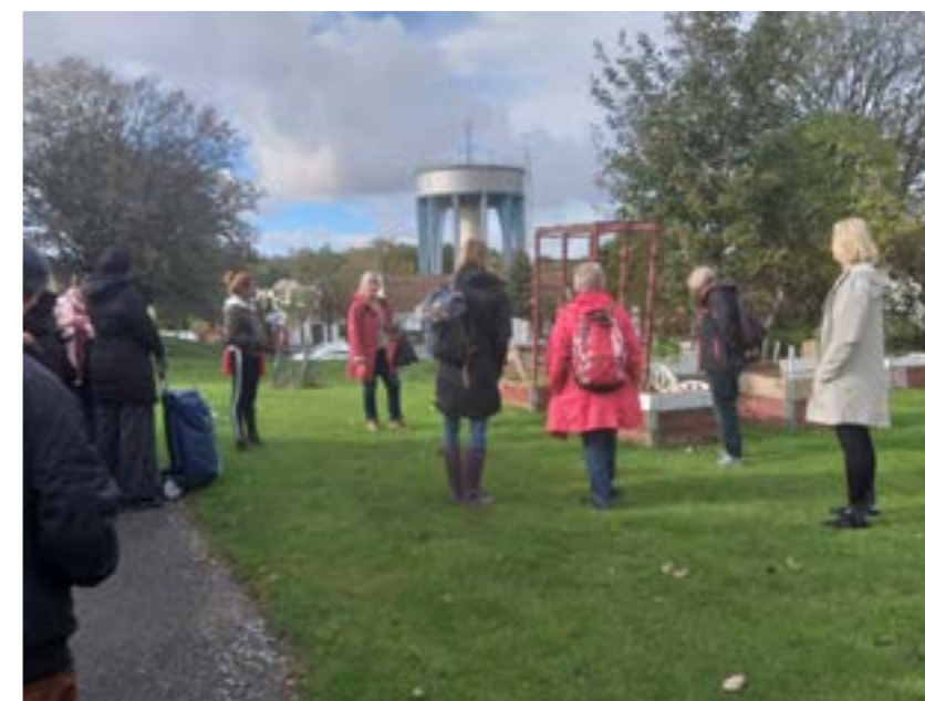
Föreningsafaridagar - öppna rundvandringar för att upptäcka det rika föreningslivet i stadsdelen

”Det behövs i första hand stöd från stadsdelen. En förening kan inte göra allting själv, många föreningar tar för mycket ansvar och de slutar med att dom inte gör något. Därför behövs det och det är extra viktigt att stadsdelen ger dessa föreningar stöd. De kan betyda till exempel att de ansvar för vissa grejer, för de har också ett ansvar. Vårt mål är att få ett bättre biskopsgården och det kan vi uppnå genom att samarbeta. Ekonomiskt stöd, en förening kan inte göra något utan ekonomisk stöd.” (Förening N1)