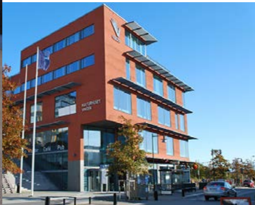
Kulturhuset "Vingen" i Torslanda

”Fånga upp ungdomars intressen och få dem att utvecklas i sina idéer eller åtaganden.”