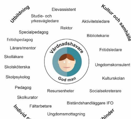
Detta är exempel på funktioner och professioner som kan samverka kring barn och unga för att främja skolnärvaro.

Elevhälsan är en central aktör i arbetet med att främja skolnärvaro och en viktig part framförallt i det operativa arbetet för samverkan 13 . Det ingår även i elevhälsans generella arbete att främja elevers lärande, utveckling och välbefinnande 14 .