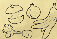
Frukt- och grönsaksrester