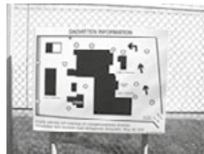
Exempel på den typ av informationsskylt som bör finnas på området.