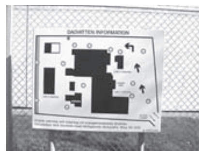
Exempel på den typ av informations- skylt som bör finnas på området.