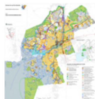
Karta 2: Regler och rekommendationer