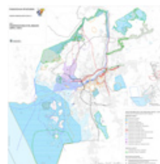
Karta 3: Riksintressen