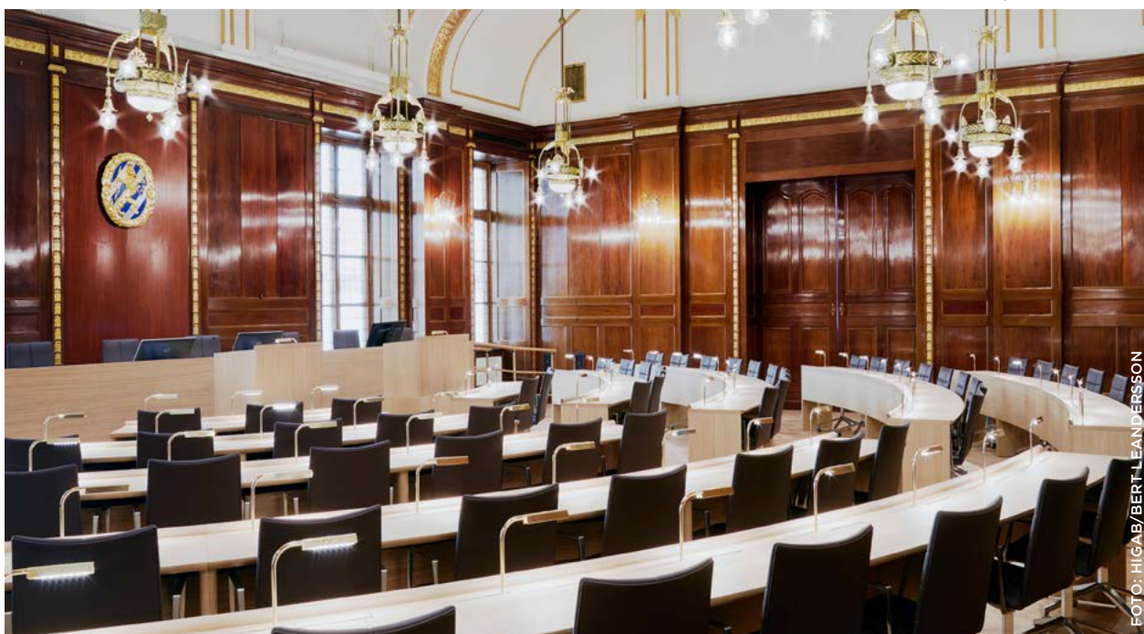
Kommunfullmäktigesalen i Börsen

Göteborgs Stads kommunstyrelse består av 18 kommunalråd, varav 13 ledamöter och fem ersättare.