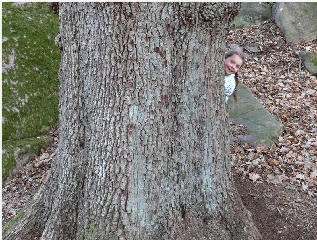
Eken – en av fler ädellövträd med stort naturvårdsvärde – men har också en social roll till exempel genom att vara bra gömställen för barn.

En samrådsgrupp för skogsskötselsfrågor ska vidare etableras. Denna samrådsgrupp ska omfattas av representanter från olika intressenter, myndigheter och övriga organisationer som är i kontakt med fastighetskontorets skogar. Målen med samrådet är att diskutera och förankra planerade åtgärder samt utvärdera utförda åtgärder utifrån denna skogspolicy.