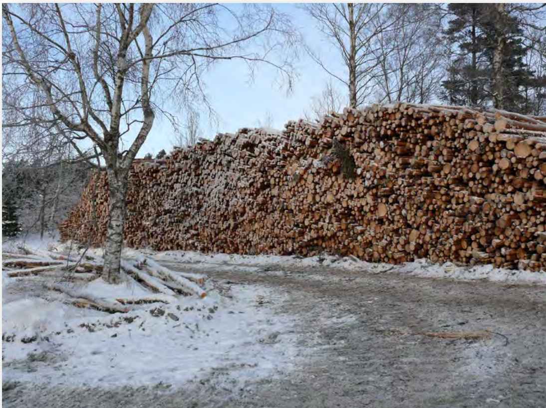
Barrmassaved till pappersindustrin vid Grimåsvägen i Rödbo.