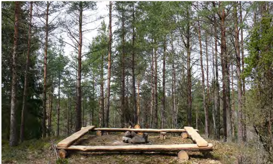
Grillplats med utsikt över skogen, Dockered i Bergum.