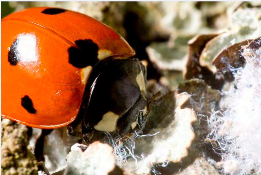
Nyckelpiga på skogsstam.