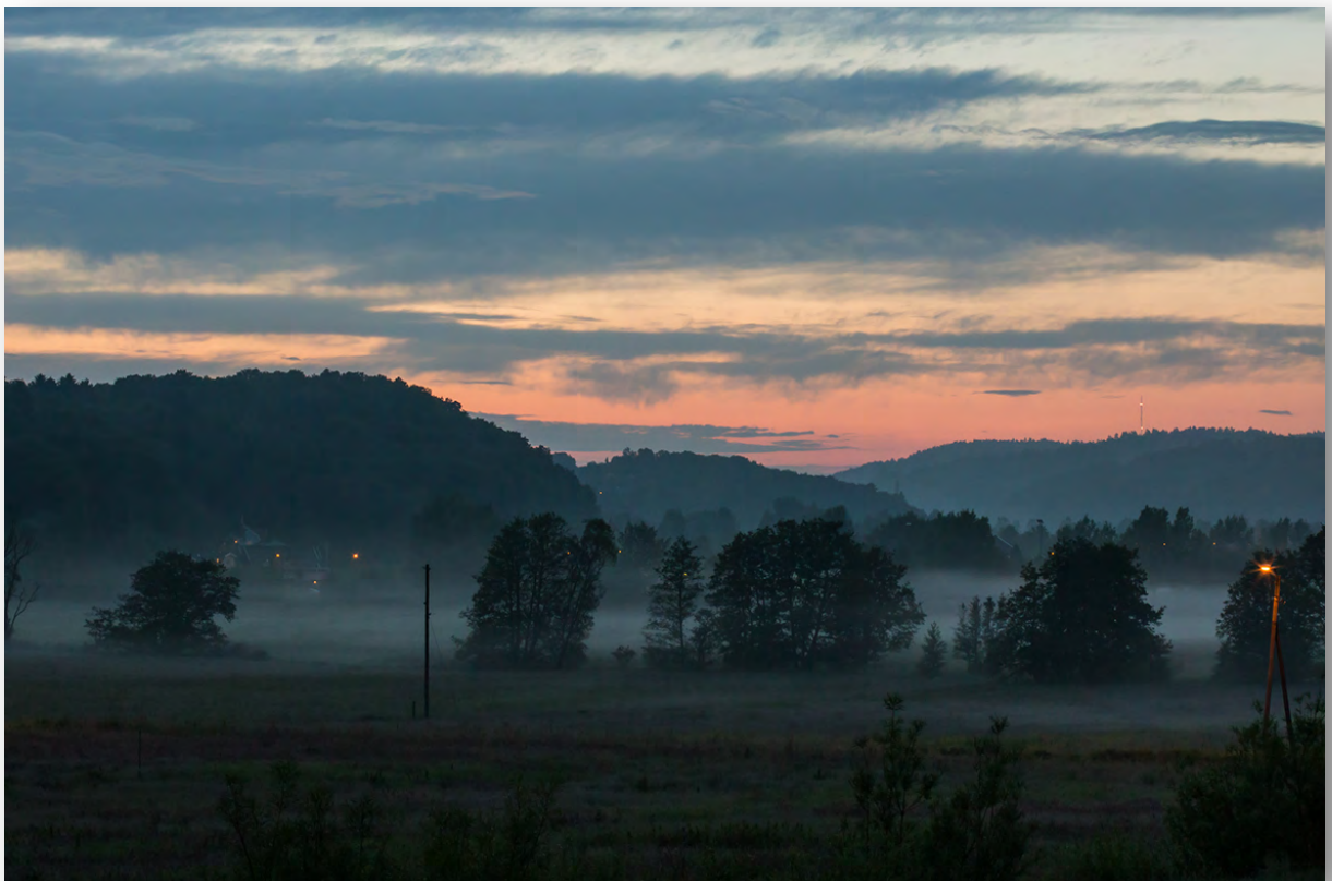
Vy från utkanten av Göteborg en tidig junimorgon.

Detta ställer speciella krav på skogens skötsel så att dess träd är stabila mot vind och friställning vid en exploatering.