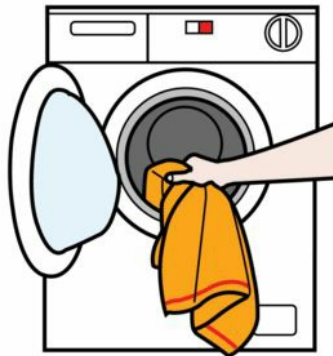
Tvätta, sortera tvätt och mangla