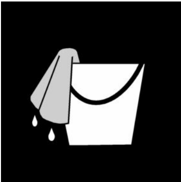
Hålla rent i caféet