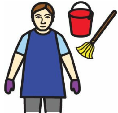
Städa tvättstuga och andra lokaler