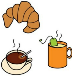
Sälja mat och dryck i caféet