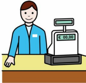
Hantera kassa och bemöta kunder