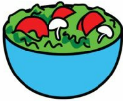
Göra pajer och sallader