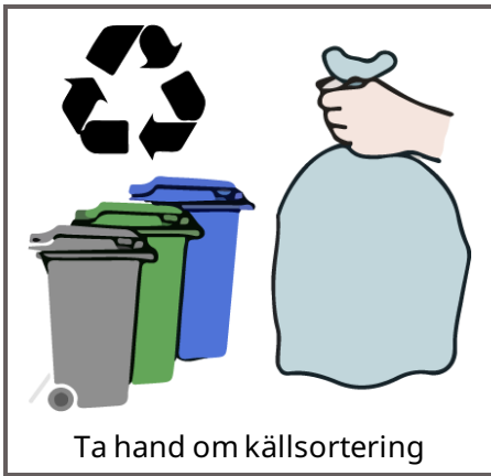
Ta hand om källsortering