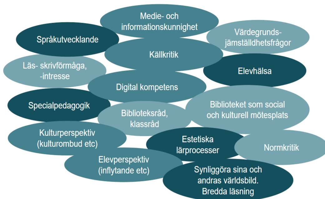
Bild på möjliga perspektiv som ingår i skolbiblioteksverksamhet utifrån styrdokument, rapporter, forskning och intervjuer av nyckelpersoner inom skolbibliotek i Göteborgs Stad.

I vår genomgång av styrdokument, rapporter och forskning hittade vi ingen tydlig beskrivning av vad som ska ingå i skolbiblioteksverksamhet. Uppdraget är både brett och komplext. Bilden nedan är ett försök att samla olika möjliga perspektiv på vad skolbiblioteksverksamhet kan innehålla utifrån styrdokument, rapporter och forskning. Bilden har även utvecklats i de intervjuer vi gjorde för att få en fördjupad förståelse. De olika perspektiven är inte viktade mot varandra. Bilden har använts som diskussionsstöd under intervjuerna med rektorerna.