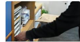
Service och administration