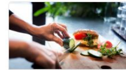
Café och kök

Förslag till ny arbetsgrupp gällande utvärdering av serviceguiden som är ett stöd i val av utförare av daglig verksamhet (DV)