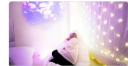
Stöd och stimulans