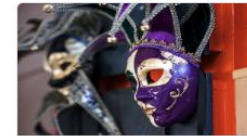
Kultur, drama och musik