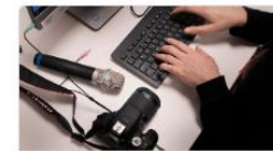
IT och data, ljud och bild