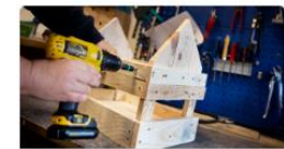
Hantverk och skapande