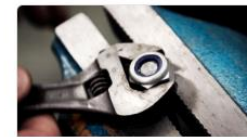
Industri, produktion och teknik