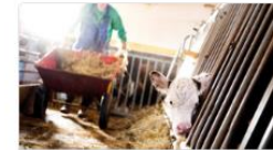
Skog, djur och natur