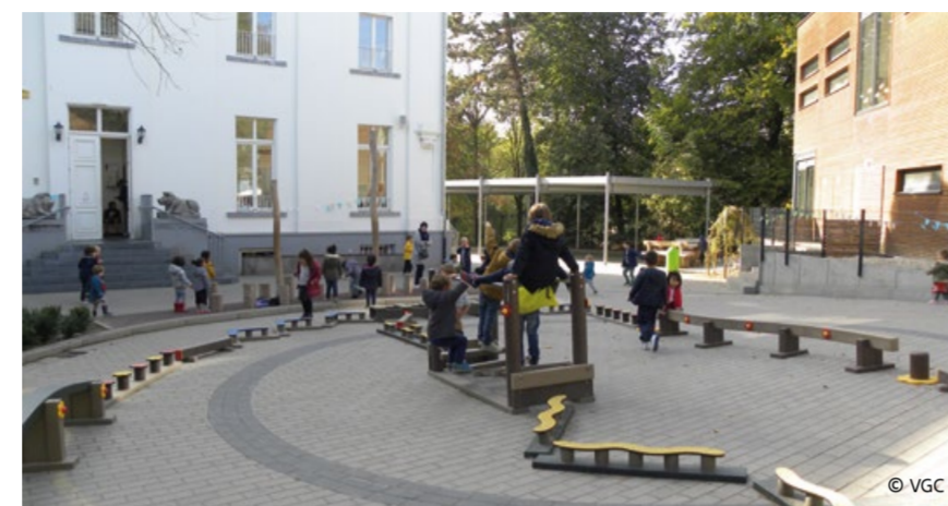
Basisschool Heilig-Hart (Jette)

Nederlandstalige scholen in Brussel kunnen financiële steun en coaching krijgen om van hun speelplaats een kwaliteitsvolle buitenruimte te maken. Een plaats waar leerlingen hun talenten kunnen uiten en veel kunnen leren. In 2018 kregen 25 scholen subsidies om hun speelplaats avontuurlijker, creatiever en natuurrijker te maken.