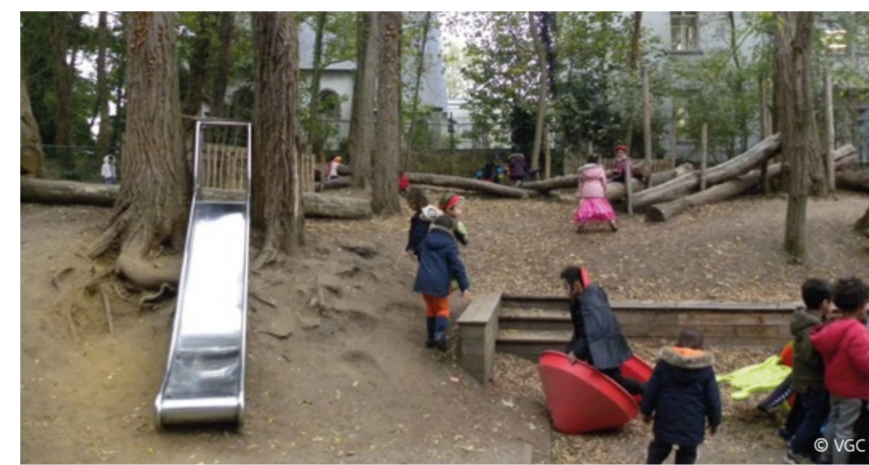
Basisschool De Iris - deel speelbos (Ukkel)