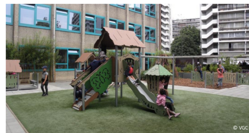
Basisschool Klavertje Vier (Brussel-Laken)