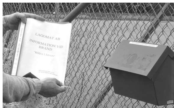
Förvara planen lättåtkomligt.

lokalerna olika kemiska produkter hanteras eller förvaras. Av planen bör också framgå om delar av lokalen vallats in (ange volym på invallning), om någon del av byggnaden försetts med sprinkler eller om annan liknande förebyggande åtgärd vidtagits. Anslå planen eller förvara den på annat sätt lättåtkomlig att använda till exempel i händelse av brand.