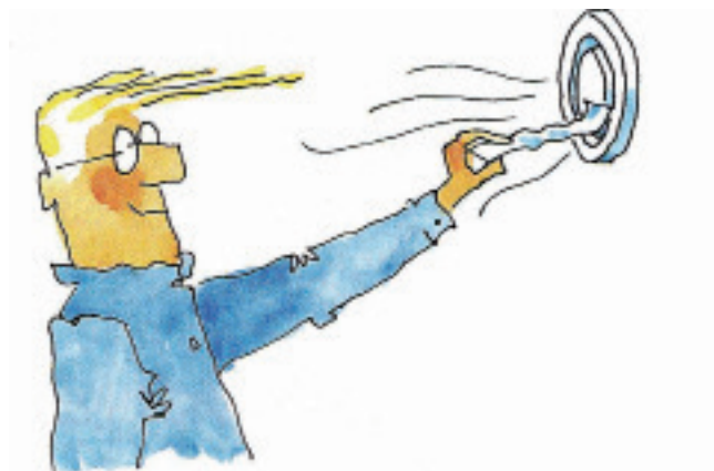
Illustration: Per Lewis-Jonsson

Fläktar och torktumlare får inte installeras utan fastighetsägarens godkännande. Den som själv sätter in till exempel en köksfläkt kan förstöra ventilationen för sina grannar.