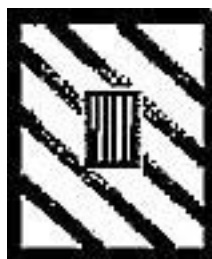
Skyddszon kring en dagvattenbrunn.