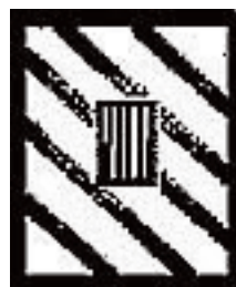
Skyddszon kring en dagvattenbrunn.