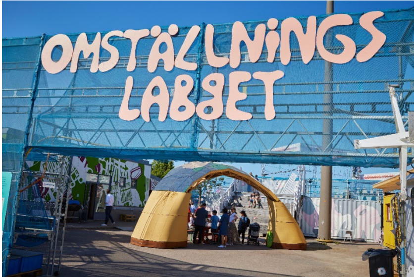
Omställningslabbet under Jubileumsfirandet sommaren 2023. Byggställningen står inte längre kvar på platsen.