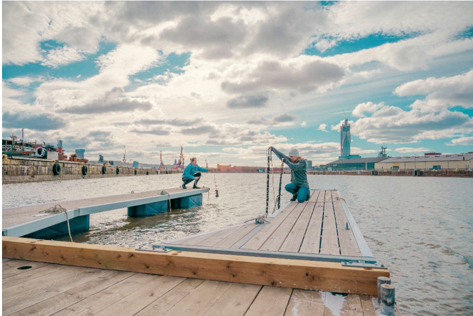
Omställningslabbet blå del – den marina kolonilotten Flytevi.