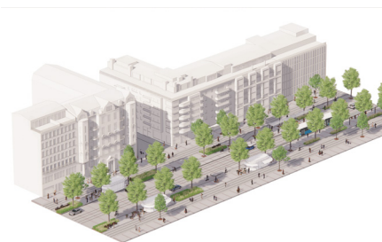
Förslag trafiklösning Hållplatskvarteret

Belysningsstolpar och reklamskåpens placering invid gångstråket mot fasaderna skapar en arkadefekt där gångbanan skärs av visuellt från butiksfasaderna. För att få bättre koppling mellan gångflöden och fasader föreslås en mer mittförlagd gångbana med belysningsstolparna placerade ut mot trädraderna.