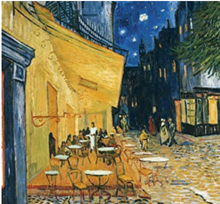
Så ser drömmen om uteserveringarna ut. Det gäller både att vara beredd på de varma kvällarna och planera för regn. Därför tror vi på riktiga uteserveringar på förgårdarna med paviljongerna som ett permanent komplement.

Power of 10 för Götaplatsen och norra Avenyn Några förslag på besöksanledningar nedan.