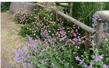
Exempel på perenner i sol / halvskugga.

för att öka attraktionen och ge fler anledningar att besöka platsen. Genom att göra Götaplatsen flexibel finns en stor potential att aktivera den med tillfälliga arrangemang. För detta behövs en generös plats men också tillägg som möjliggör att tex kunna koppla på el och vatten eller fundament för tex utomhus bio osv.