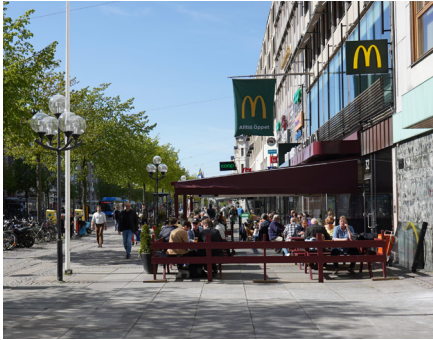
Inglasad uteservering idag på Avenyn.