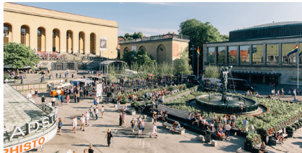
En folklig paradgata.