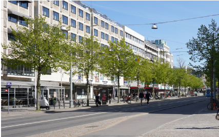
Parklind på Avenyn början av 1900-talet och nutid. De nuvarande träden har svag tillväxt på grund av dåliga markförhållanden.