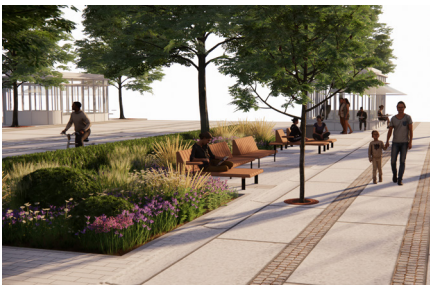
Mikroparkerna med sittplatser under träd återger grönska till gaturummet.