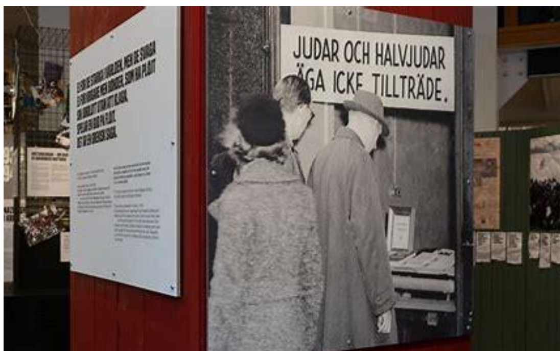
Bild Forum för levande historia utställning Sverige och Förintelsen

I samverkan med EXPO har personal på Bräcke IMA erbjudits möjlighet att ta del av kontinuerlig rådgivning och kompetensutveckling. Alla insatser anpassas och uppdateras med utgångspunkt i de behov som skolan har. Projektet sträcker sig över ett läsår (hösten 2023 till våren 2024) med följande inplanerade aktiviteter för att nå projektets mål: enkätundersökning, heldagsutbildning, workshops/föreläsningar, kontinuerlig rådgivning, prenumeration Expo radar och utvärdering.