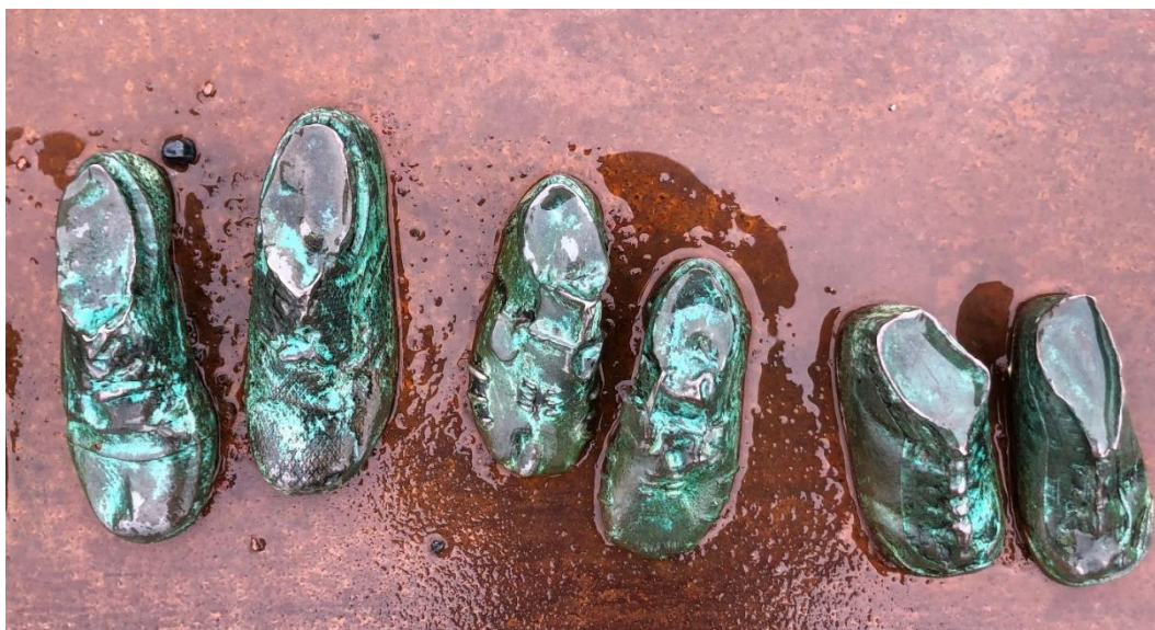
Detalj från Bastionsplatsens minnesmärke Mörker av Kent Karlsson.

Ann Hanbert Samhällsutveckling och hållbarhet