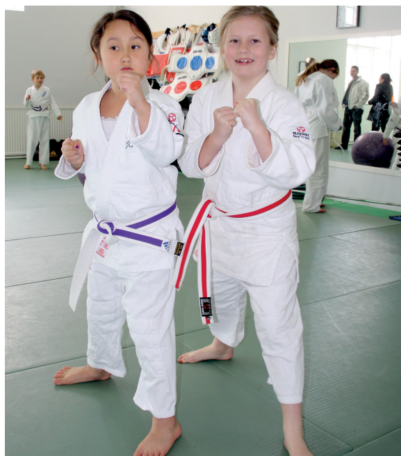
Ju Jutsu på Dokan dojo.

Med utgångspunkt i denna ska styrgruppen tydliggöra förvaltningarnas och bolagets interna rollfördelning och ansvar i det gemensamma arbetet med att förverkliga visionen.