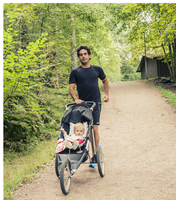
Varierande natur i området.