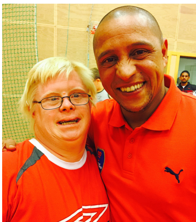
Foto: Fotbollsträning med Grunden Bois.