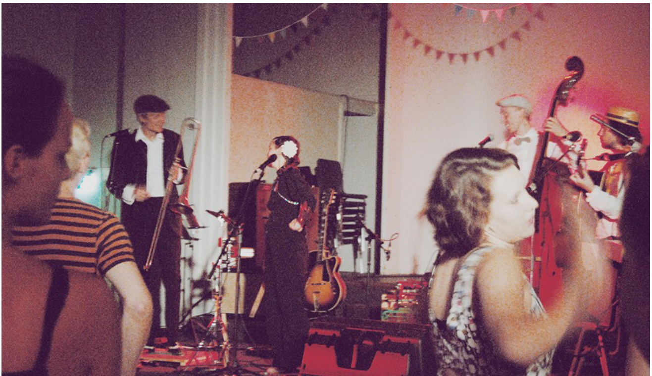
Lindy Hop på Kompani 415