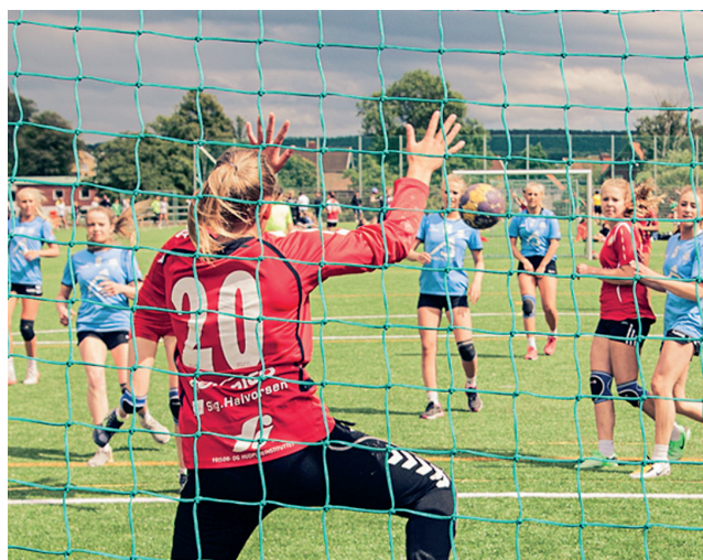
Partille Cup på Kvibergs konstgräsplaner.