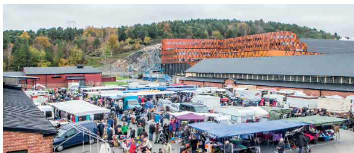
Kvibergs marknad med Prioritet Serneke Arena i bakgrunden.