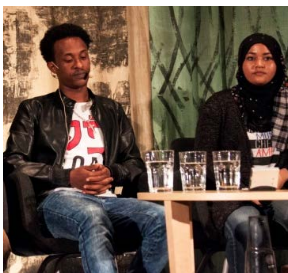
Två unga flyktingar från Eritrea medverkade i personalutbildningen ”Eritrea i våra hjärtan”, och berättade om upplevelserna under sin flykt från diktaturen.

Under 2014 genomfördes en intervjustudie med cirkulära migranter bland göteborgare. Studien ”Migration och arbete” finansierades av Europeiska Socialfonden.