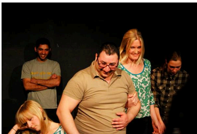
Teaterstudiecirkel inom Flyktingguide/Språkvän. Efter kursen framfördes den inövade pjäsen på "Frilagret".

Flyktingguide/Språkväns motto är att ”integration uppstår där människor möts”. Studiecirklar och gruppaktiviteterna är komplement till verksamhetens kärna. En restaurangkok har initierat kurser i internationell matlagning. Andra kurser har sitt ursprung i efterfrågan hos de nyanlända, till exempel simkurs och cykelkurs. Gruppaktiviteter kan handla om att bjudas in till Kopparbergs/Göteborgs FC:s fotbollsmatcher, göra utflykter i skärgården eller gå på teater tillsammans. Totalt har genomförts 74 studiecirklar och 82 gruppaktiviteter.