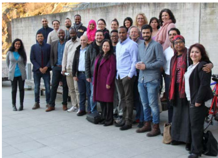
Deltagare, mentorer och medhjälpare i Vägvisaren.

Av andra årets 19 adepter har åtta kommit i arbete under vägvisarperioden, fyra har kommit igång med utbildning och en person har startat ett företag.