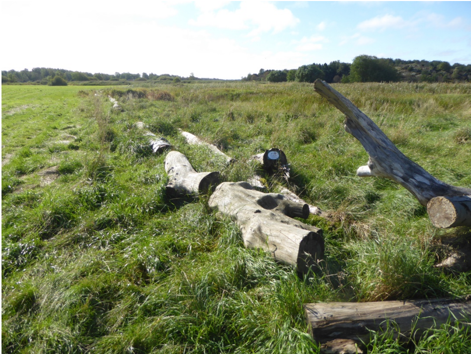
Figur 8. Biodepån i Sjöbacka.

Uppemot 350 stockar utlagda, dels runt parkeringsplatsen vid Stora Fiskebäcksvägen, dels i två stora ringar ute i strövområdet. Stockarna ligger solexponerat i öppen gräsmark, även om vissa skuggas av högvuxna örter och vass. Nedbrytningsgraden varierar, och här återfinns ett flertal olika trädslag såsom björk, bok, asp, al, ask, alm, tall och gran. Depån har en artrik funga och hela 65 vedlevande arter hittades, vilket gör lokalen till den rikaste av de som undersökts i denna inventering. Ett remarkabelt fynd utgörs av ett flertal stromata av en skiktdyna Daldinia sp. på en grov askstam. Substrat, utseende och kemi indikerar starkt att det rör sig om äkta skiktdyna Daldinia concentrica . Detta utgör sannolikt första fyndet i Sverige, men arttillhörigheten kan inte bekräftas med full säkerhet eftersom ascosporer saknas i det insamlade materialet. Vidare hittades ovanligare arter som vittagging Irpex lacteus , svarteggad skölding Pluteus atromarginatus , slemmig tofsskivling Pholiota adiposa , och kantarellmussling Plicaturopsis crispa .