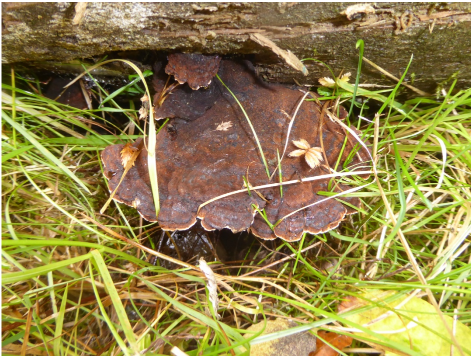
Figur 12. Sydlig sotticka i Grimbo

Mycket ovanlig art, rödlistad som sårbar. Arten är en vitrötande vednedbrytare som i huvudsak förekommer på lågor av bok och stundom alm i sydliga ädellövskogar, i Sverige främst känd från Skåne och Småland. Arten påträffades på grov stock, troligen av bok, i biodepån vid Grimbo, säkerligen på samma stock där den också noterades under inventeringen 2016.