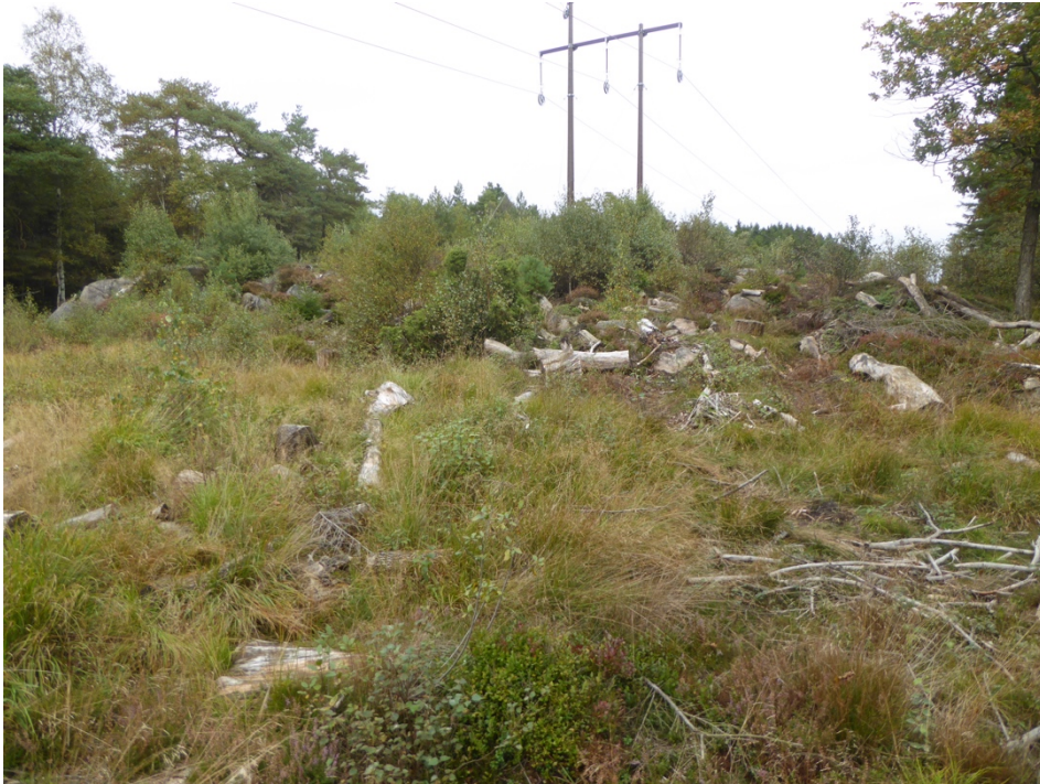
Figur 4. Biodepån vid Delsjön.

Mellan Lilla Delsjön och en kraftledningsgata med öppen hällmark och sumpstråk, omgiven av kuperad barrblandskog ligger ett 100-tal medelgrova stockar och stubbar utspridda i terrängen. Många av stockarna är uppsågade i mindre bitar. Nedbrytningsgraden varierar, men de flesta stockarna är relativt gamla. Trädslagen är därför svåra att avgöra, men ek, bok, al, alm, björk, körsbär och gran finns representerade. 41 vedsvamparter noterades, däribland oxtungssvamp Fistulina hepatica NT, ormticka Antrodia serpens , tratticka Polyporus melanopus , almskivling Hypsizigus ulmarius och kantarellmussling Plicaturopsis crispa .