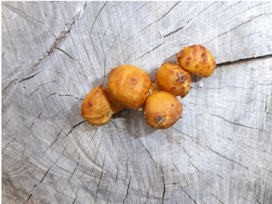
Figur 18. Slemmig tofsskivling i Årekärr.

Mindre vanlig art som i huvudsak växer på bok, gärna som parasit på levande träd i äldre bokskogar men även som nedbrytare på boklågor. Under inventeringen hittades arten på sågytorna av grova bokstammar i biodepåerna vid Hjällbo, Sjöbacka och Årekärr.