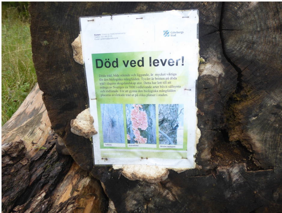
Figur 21. Död ved lever! Upp till bevis för korktickorna i Årekärr.

Bland de undersökta biodepåerna befinner sig några i mer eller mindre öppen mark (Brudaremossen, Grimbo, Sjöbacka), några i skogsbryn (Bergsjövägen, Hjällbo, Årekärr) och några i sluten skog (Grästuvevägen, Stora Torp). Delsjödepån ligger i en kraftledningsgata med öppen håll-/hedmark genom blandskog. Här är det svårare att dra några slutsatser utifrån depåernas artlistor, men sannolikt bryts ved i öppen mark ned fortare än i skogsmark. En hög sol- och vindexponering är en faktor som påskyndar uttorkandet av veden, vilken tappar barken fortare och bryts ned snabbare. Olika vedsvamparter föredrar fuktig och torr ved, vilket gör att placering i skogsbryn eller halvskugga kanske gynnar artdiversiteten mest. Som tidigare nämnts kan depåerna fungera som spridningskälla till intilliggande skog, men då är det fördelaktigt om det är samma trädslag i skogen som i depån.