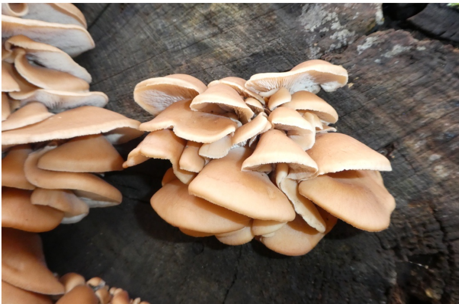
Figur 14. Rynkmussling i Hjällbo.

Ovanlig och tidigare rödlistad art som förekommer på döda lågor och torrträd såväl som i stamskador på/håligheter i levande träd. Arten förekommer ofta i parker och alléer på exempelvis alm, bok, asp och björk. Under inventeringen hittades arten på sågytan av en grov almstock i biodepån i Hjällbo.