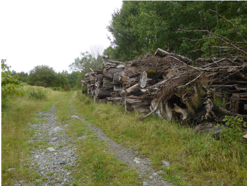
Figur 10. Biodepån i Årekärr.

I två stora, höga travar längs skogsväg och ridstig i en dalgång i västra kanten av det stora sammanhängande skogsområdet Sandsjöbacka, i anslutning till Årekärsvägen, ligger flera hundra (uppskattningsvis, ej noggrant räknade) stockar varav många är grova - mycket grova. Trädslagen är mycket blandade och här finns bland annat bok, ek, alm, hästkastanj, pil, oxel, björk, ask, lind och gran. Nedbrytningsgraden varierar, men de flesta stockarna har fortfarande bark kvar. I anslutning till depån finns halvöppna igenväxningsytor med viss kulturprägel och yngre - medelålders skog längs bergssidorna med asp, björk och tall. Depån är ganska artrik på vedsvamp, 58 arter hittades här och av intressantare arter kan nämnas poppeltofsskivling Hemipholiota populnea NT (på två stockar), liten bokdyna Annulohypoxylon cohaerens , lindskår Holwaya mucida , almskivling Hypsizigus ulmarius , slemmig tofsskivling Pholiota adiposa och kantarellmussling Plicaturopsis crispa .