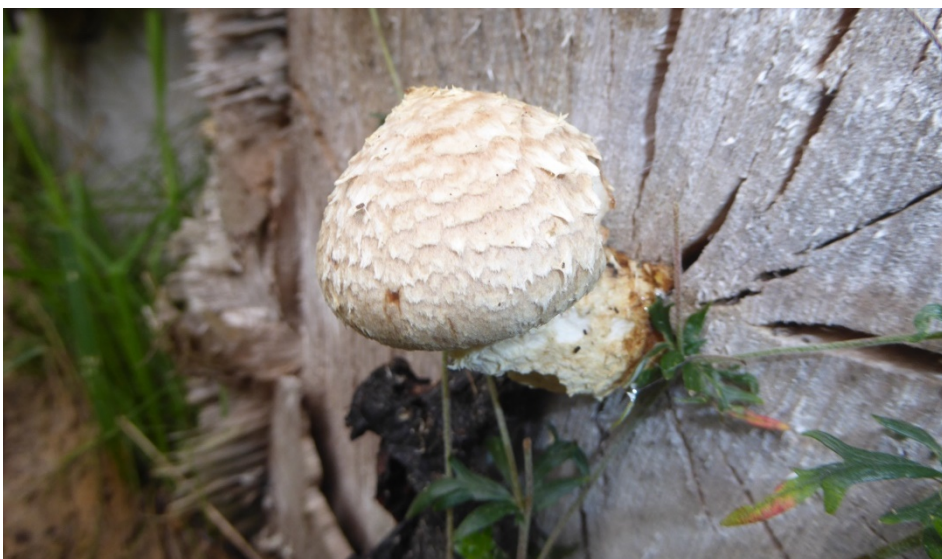
Figur 17. Poppelfofsskivling i Årekärr.

En sällsynt och rödlistad (nära hotad) art som främst växer på poppel och asp, gärna på sågytor av upplagda stockar. I Göteborgstrakten uppträder arten så gott som uteslutande på upplagd ved, något av en karaktärsart för biodepåer således! Under inventeringen hittades den i biodepåerna vid Brudaremossen och Årekärr, på den sistnämnda lokalen på två olika stockar. Däremot återfanns den ej vid Sjöbacka, där den påträffades under inventeringen 2016.