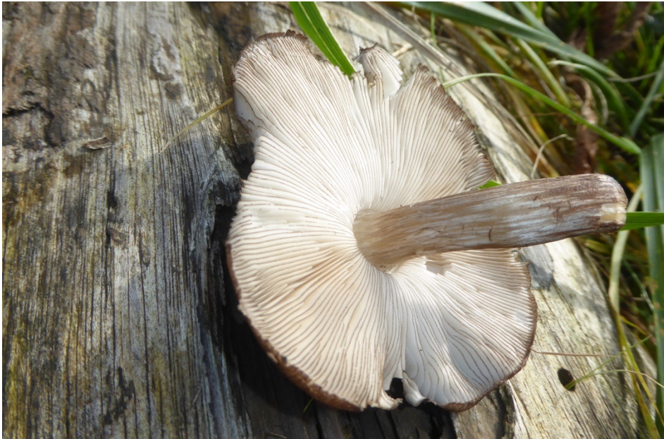
Figur 16. Svarteggad skölding vid Sjöbacka.