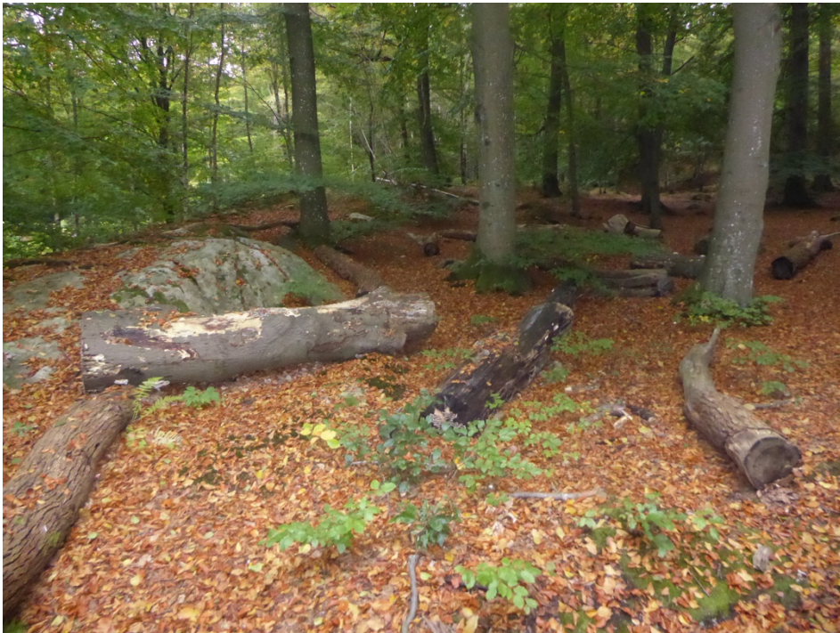
Figur 9. Biodepån i Stora Torp.

I slutna bokskogsmiljö vid Stora Torps ridklubb i kanten av Delsjöområdet ligger ett 30-tal medelgrova-grova stockar av bok och pil. De flesta har inte kommit så långt i nedbrytningen och är fortfarande barkklädda. Här återfanns 27 arter vedsvampar. Av mindre vanliga arter kan kärnsvampen Nemania atropurpurea nämnas.