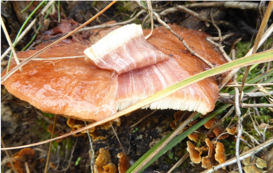
Figur 13. Oxtungssvamp i Delsjön. Under oxtungssvampen tittar några raggskinn fram.