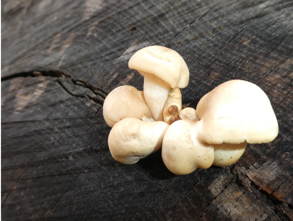
Figur 15. Almskivling i Årekärr.

Mindre vanlig art som främst är knuten till alm och därmed på sikt kan vara hotad av almsjukans effekter. Arten förekommer såväl på död liggande eller stående almved som i stamskador på levande träd. Den hittades under inventeringen på grova almstockar i depåerna vid Brudaremossen, Delsjön och Årekärr.