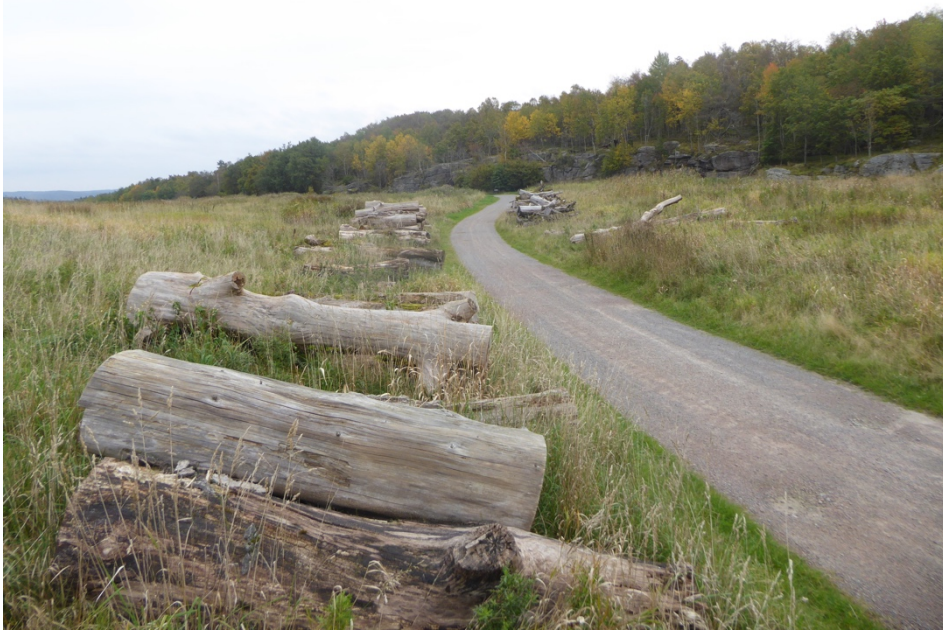
Figur 3. Biodepån vid Brudaremossen.

Längs körväg på östra sidan av Brudarebacken ligger ett drygt 100-tal stockar upplagda i låga travar eller rader på ömse sidor av vägen. Stockarna är i huvudsak grova - mycket grova och relativt nedbrutna. Ek och bok dominerar med inslag av alm, ask, poppel och gran. Stockarna ligger öppet men i hög vegetation av kvävegynnade arter såsom hundäxing, brännässla, åkertistel, jätteloka med mera. Strax söder om depån finns klenved och ris i höga travar. 26 arter vedsvampar noterades, ett relativt lågt antal, vilket kan bero på att samtliga stockar är långt gångna i nedbrytningsprocessen vilket i sin tur medför låg variation i substraten. Bland intressanta arter kan nämnas poppelfofsskivling Hemipholiota populnea NT och almskivling Hypsizigus ulmarius .