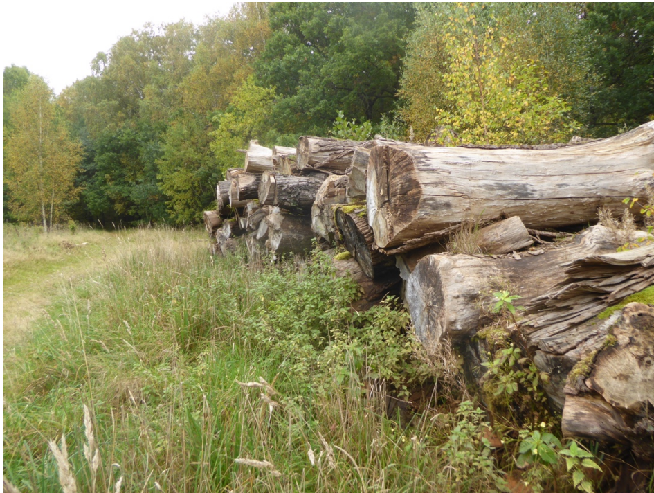
Figur 7. Biodepån vid Hjällbo.

I kanten av en ledningsgata omgiven av ekdominerad lövskog vid Herregårdsgärdet i Hjällbo ligger en trave med ca 60 grova - mycket grova stockar av ek, lind, alm, ask, björk och bok. De flesta stockarna är ganska rötade och barklösa men någon enstaka är färskare och troligen ditplacerad efter de andra. 27 arter hittades, däribland de ovanligare arterna lindskaål Holwaya mucida , rynkmussling Lentinellus vulpinus och slemmig tofsskivling Pholiota adiposa .