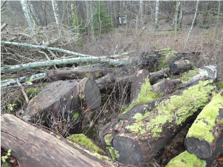
Figur 6. Biodepån vid Grästuvevägen.

Här ligger ett 30-tal grova - mycket grova stockar i en lövblandskogskant med björk, sälg och al utvräkt i en stor bråte tillsammans med ris och klenved i hög vegetation av sly, hallon, nässlor med mera. Stockarna ligger tämligen beskuggat, och trädslagen utgörs främst av knäckepil, bok och björk. Nedbrytningsgraden är varierande, men många stockar är relativt färska med kvarsittande bark. Få vedsvamparter hittades, endast 17 stycken, varav inga kan betraktas som särskilt naturvårdsintressanta eller ovanliga.