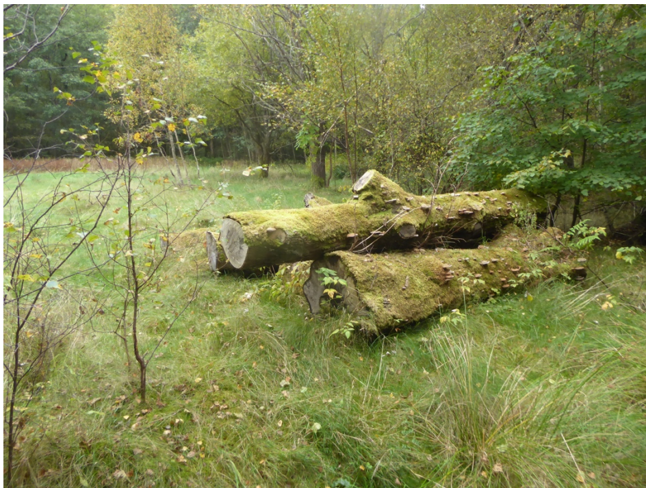
Figur 2. Biodepå vid Bergsjövägen.

Ett tiotal medelgrova lindstockar upplagda i en trave i ett igenväxande odlingslandskap längs bommad väg väster om Bergsjövägen, sydväst om Gråbacka, Angered. Stockarna ligger i halvskuggigt läge i bryn mellan triviallövskog med yngre sälg, björk och al och en igenväxande gammal åkerlycka. Stockarna är relativt färska och har huvuddelen av barken kvar. Fungan är fattig, men lindskål Holwaya mucida förekommer rikligt och på så gott som samtliga stockar i traven. Totalt noterades endast 12 arter vilket återspeglar depåns litenhet och enahanda sammansättning vad gäller träslag och nedbrytningsstadier.