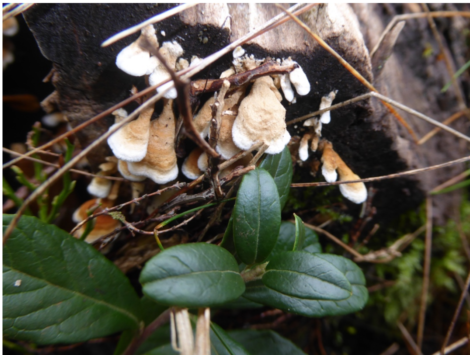
Figur 11. Kantarellmussling vid Delsjön.

Kantarellmussling är signalart enligt Skogsstyrelsen, men är inte alltför ovanlig i lämpliga miljöer i Göteborgstrakten. De lämpliga miljöerna utgörs ofta av slutna, fuktiga lövskogsmiljöer och favoritsubstratet tycks vara, ofta stående/kvarsittande, död klenved av exempelvis hassel, bok och klibbal även om många andra lövträd också kan komma i fråga. Under inventeringen påträffades arten på bokstammar i biodepåerna i Delsjön, Sjöbacka och Årekärr.