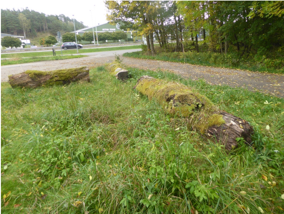
Figur 5. Biodepån vid Grimbo.

Ett drygt tjugotal grova stockar upplagda runt parkeringsplatser vid Grimbo bågskyttebana. Stockarna är relativt gamla, barklösa och mossbelupna. Trädslagen är svårbedömda men bok och alm förekommer. Stockarna ligger i huvudsak solexponerat men i högvuxen ört- och gräsvegetation och ganska nära bryn mot lövskog. Vid novemberbesöket hade en stor grushög lagts upp, dessvärre mot just den stock som hyser sydlig sotticka. Dock påverkades endast fruktkropparna på ena sidan stocken. Ett udda fynd utgörs av barrvedsspecialisten vedmussling Gloephyllum sepiarium som här växer på lövved, troligen bok. Totalt noterades 28 arter varav följande mer intressanta: Sydlig sotticka Ischnoderma resinosum VU återfanns på en bokstock liksom under inventeringen 2016. Den mindre allmänna finflockiga tofsskivlingen Pholiota tuberculosa kan också nämnas.