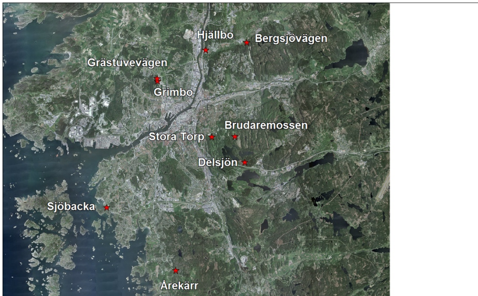
Figur 1. Karta över de undersökta biodepåerna.

Åtta biodepåer i Göteborgs stad och en i Härryda kommun (figur 1) besöktes vid två tillfällen vardera under hösten 2017. Besöken skedde den 20 och 29 september samt den 24 november. Vid besöken noterades depåernas storlek, struktur, trädslagssammansättning, nedbrytningsstadium och omgivande miljö. Samtliga åtkomliga stockar i depåerna undersöktes noggrant och samtliga påträffade vedsvamparter på varje lokal noterades. Svårbestämda arter samlades in för att bestämmas med hjälp av mikroskop och andra hjälpmedel.