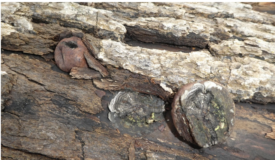
Figur 20. Äkta skiktdyna (?) vid Sjöbacka.

Ett mycket spännande fynd som gjordes på en grov askstock i Sjöbackas biodepå. På stocken växte ett flertal stromata av en skiktdyna. Substratet pekar entydigt mot den på kontinenten vanliga men i Sverige aldrig påträffade äkta skiktdynan Daldinia concentrica s. str. . Samtliga karaktärer såsom stromats utseende, färg och yta samt dess lila färgreaktion i kaliumhydroxid indikerar också att det rör sig om denna art. Tyvärr innehöll det insamlade materialet inga ascosporer vilket gör att arttillhörigheten inte går att fastställa till 100%. Fyndet avser dock med 95 % sannolikhet äkta skiktdyna (Marc Stadler, Braunschweig, pers. komm).