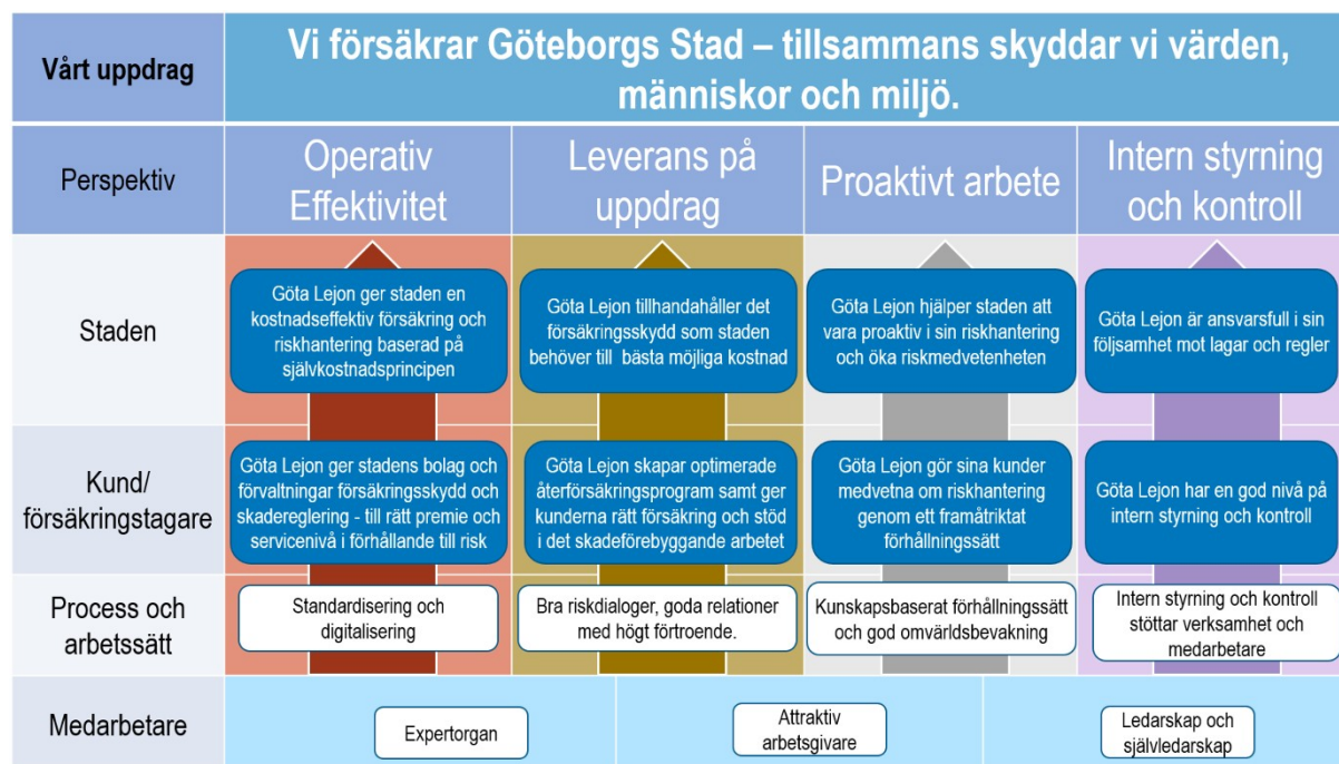
Figur 1: Göta Lejons strategikarta.

Bolagets strategi sammanfattas i en strategikarta bestående av perspektiven Operativ effektivitet, Leverans på uppdrag, Proaktivt arbete, Intern styrning och kontroll samt Medarbetare, se Figur 1.