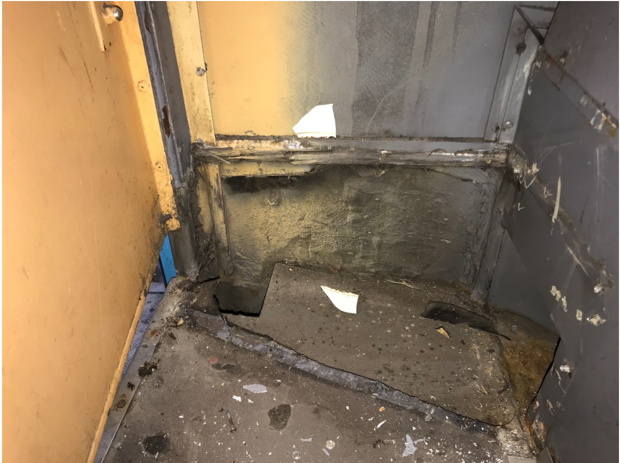
Figur 4 Ventilationskanal under rostfri sparkplåt akter om dörr 5