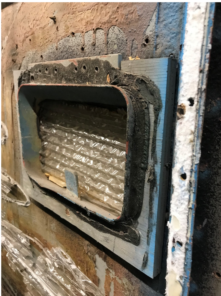
Figur 9 Svart massa utsida runt "gamla" sandpåfyllningen