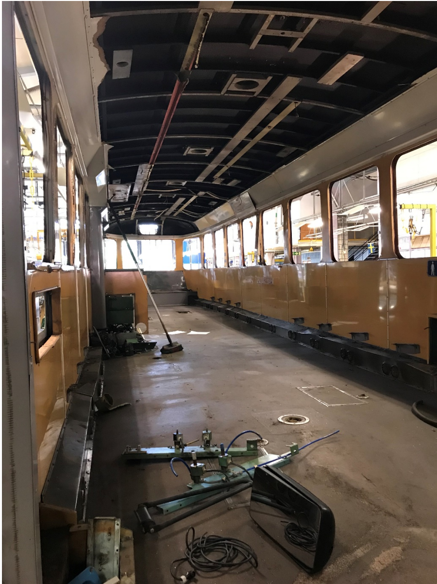
Figur 7 Översikt tak M29