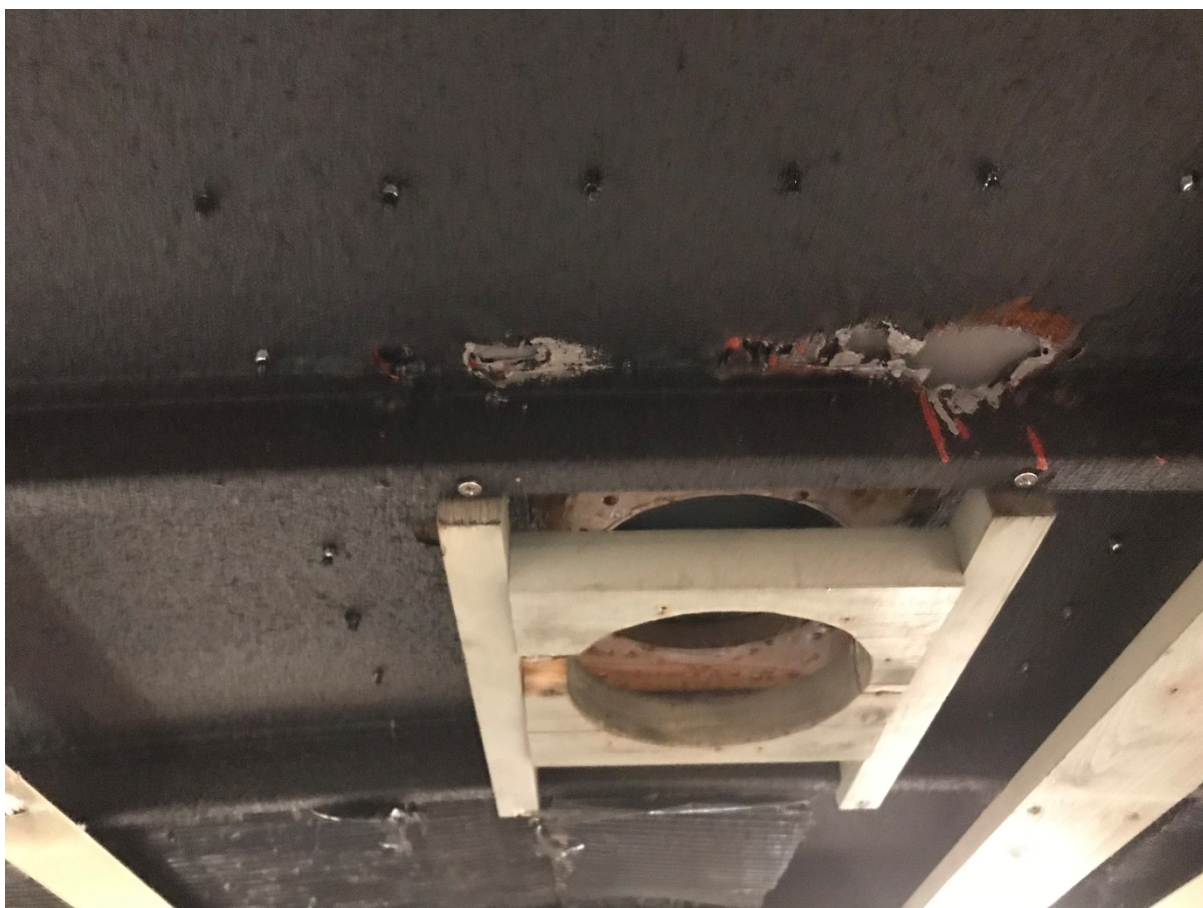
Figur 6 Täckta takplåtar & stödlinor M29