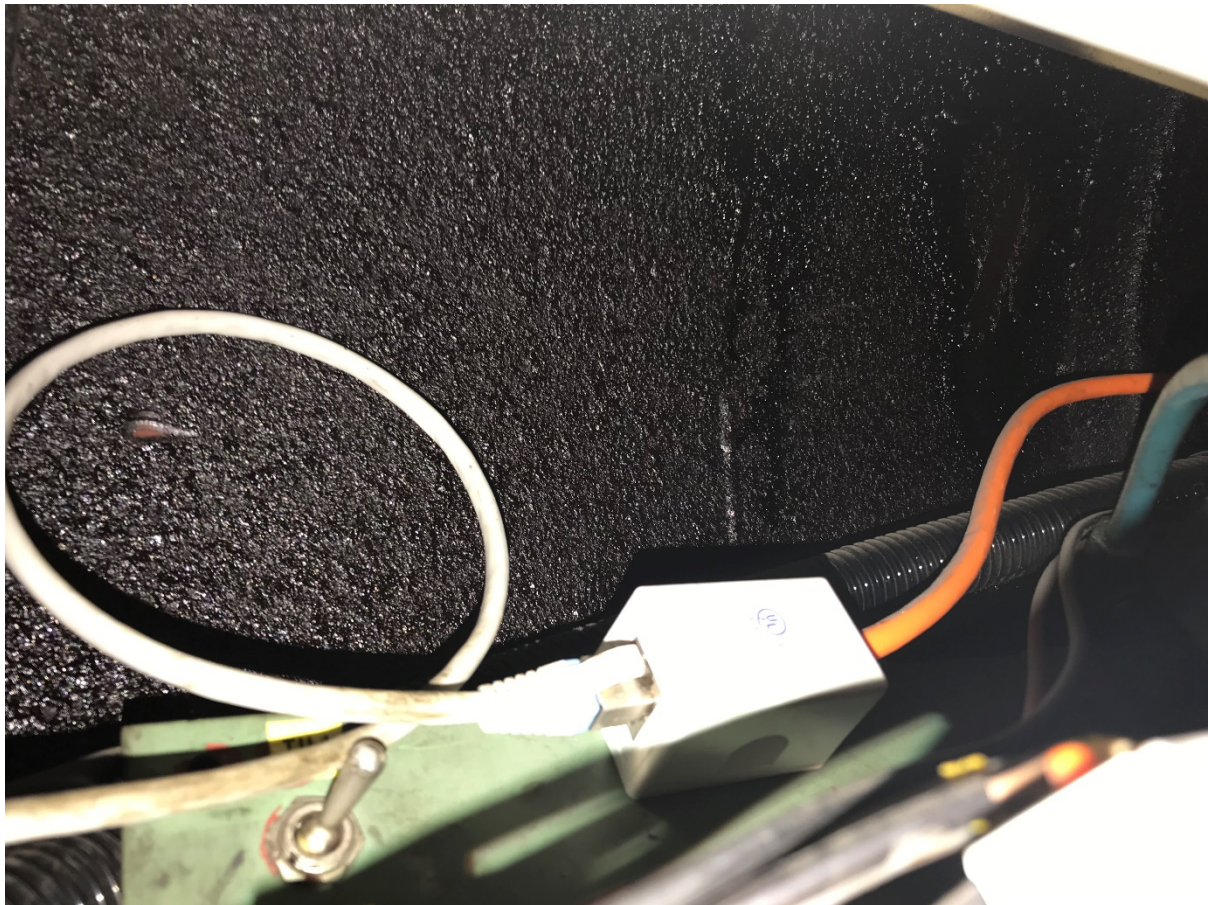
Figur 8 Svart massa på takplåtar bakom dörrmekanism