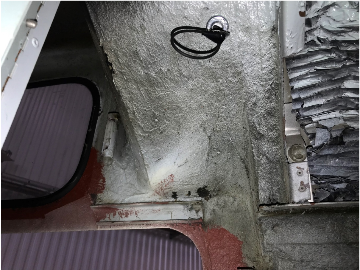
Figur 5 Vitmålad massa i takkupol