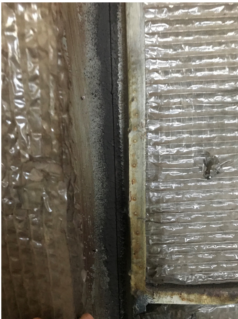
Figur 10 Svart massa vid fog yttre stödlina i vagnskorg