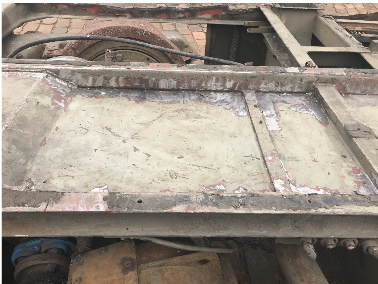
Figur 11 Sanerat ramverk - notera renslipade ytor där asbest avlägsnats