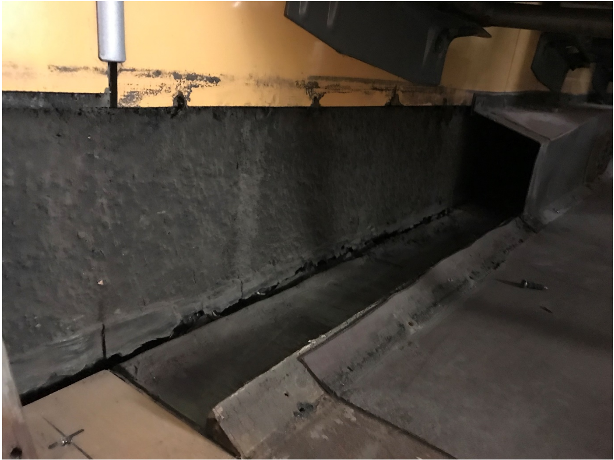
Figur 3 Ventilationskanal under rostfri sparkplåt