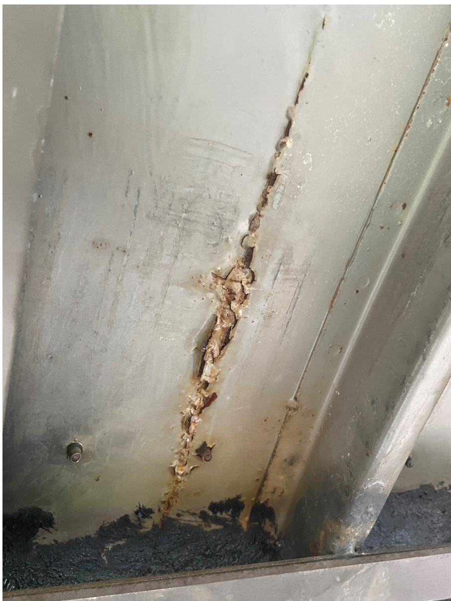
Figur 12 Svart massa på insidan av hängrännor / stödlinor där tak möter vägg