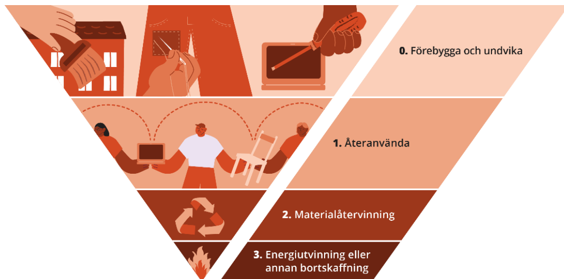
Figur 1: Illustration Göteborgs Stads prioriteringsordning för avyttring och bortskänkning

Kortfattat innebär ”Förebygga och undvika behovet av avyttring och bortskänkning” att bevara, underhålla och renovera befintlig lös egendom samt bygg- och markmaterial i den egna verksamheten. Det kan även innebära att minska behovet av avyttring redan vid anskaffning genom att till exempel minska inköpsvolymen, hyra vid tillfälliga behov och att efterfråga produkter och material med potential till lång livslängd.