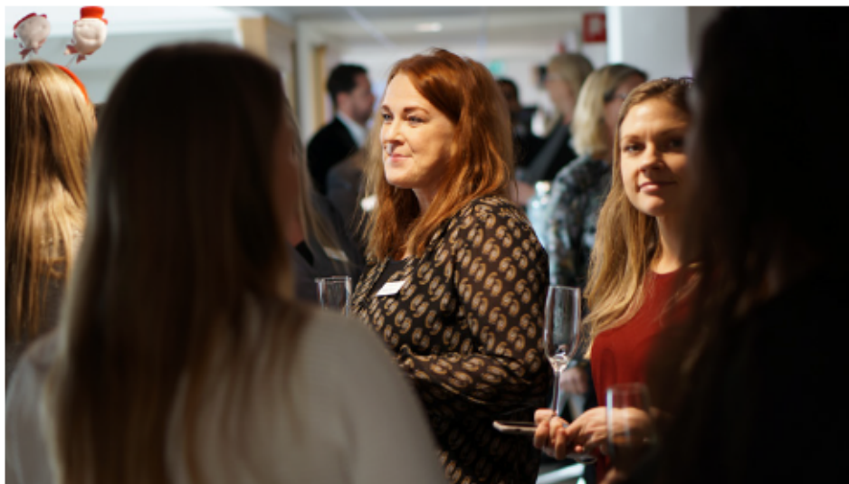
Julmingel med hyresvärdar. Boplats bjöd in hyresvärdar till mingel på Boplats kontor i Rosenlund i december 2023.