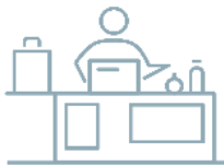
Fler framgångsrika företag

Våra tre verksamhetsmål är framgångsfaktorer för en stark och uthållig näringslivsutveckling i Göteborgsregionen. De tar avstamp i politiska styrmedel, regionala direktiv, bolagets styrdokument och förutsättningarna i vår omvärld. De tre målen är tätt kopplade till varandra och i många delar avhängiga av varandra.