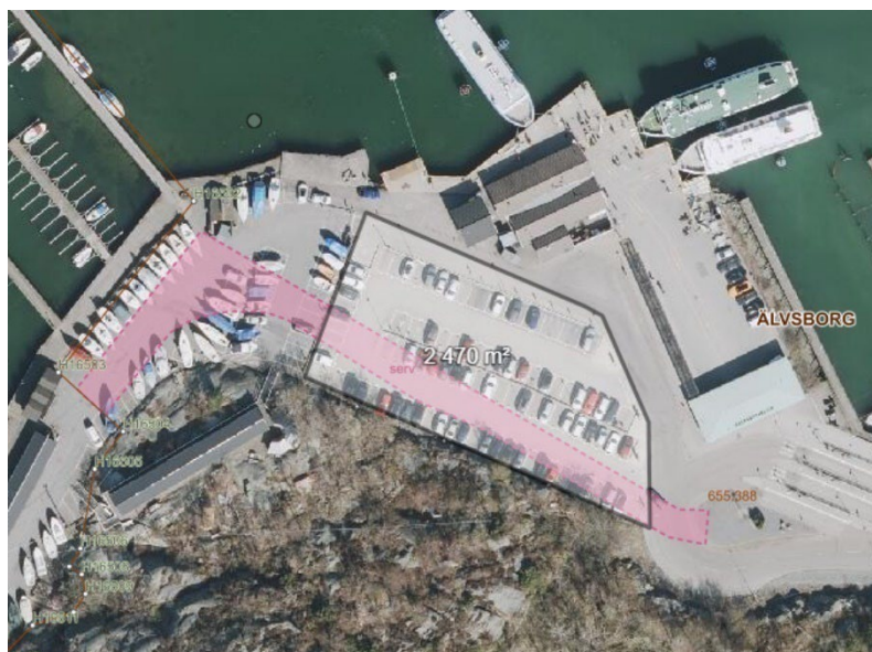
Figur 3. Föreslagen plats för parkeringshus intill färjeterminalen.

Alternativet innebär ett uppförande av ett parkeringshus på befintliga parkeringsplatser strax söder om färjeterminalen, se figur 3. Ytan är cirka 2 500 kvm och innefattar cirka 90 stycken boendeparkeringsplatser. Området är inte detaljplanelagt vilket innebär att en bygglovsansökan behöver göras.