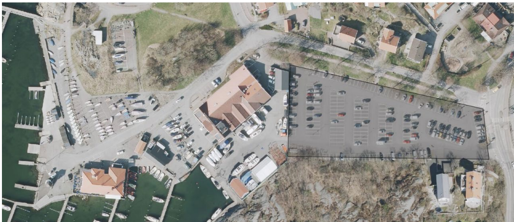
Figur 4. Översikt av Talattagatans parkering i anslutning till Göteborgs kungliga seglarsällskaps samt Nimbus fastigheter.

Idag tillhandahåller Parkeringsbolaget besöksparkeringar vid Talattagatan. Att direkt byta plats på besöksparkering till befintlig yta för båtuppläggningsyta upplevs motstridigt mot kommunfullmäktiges tidigare uppdrag och beslut. Troligen krävs en omfördelning av Parkeringsbolagets platser och kunder.