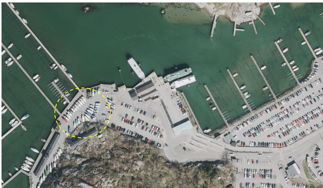
Figur 1. Båtupställningen väster om färjeterminalen vid Saltholmen.

Alternativen har studerats och beräknats översiktligt och vid en eventuell vidare hantering av något alternativ behövs en mer omfattande utredning tas fram med fokus på genomförbarhet och kostnad. En summering av alternativ och ekonomisk kalkyl ses i tabellen nedan. Varje alternativ beskrivs utförligt därefter.