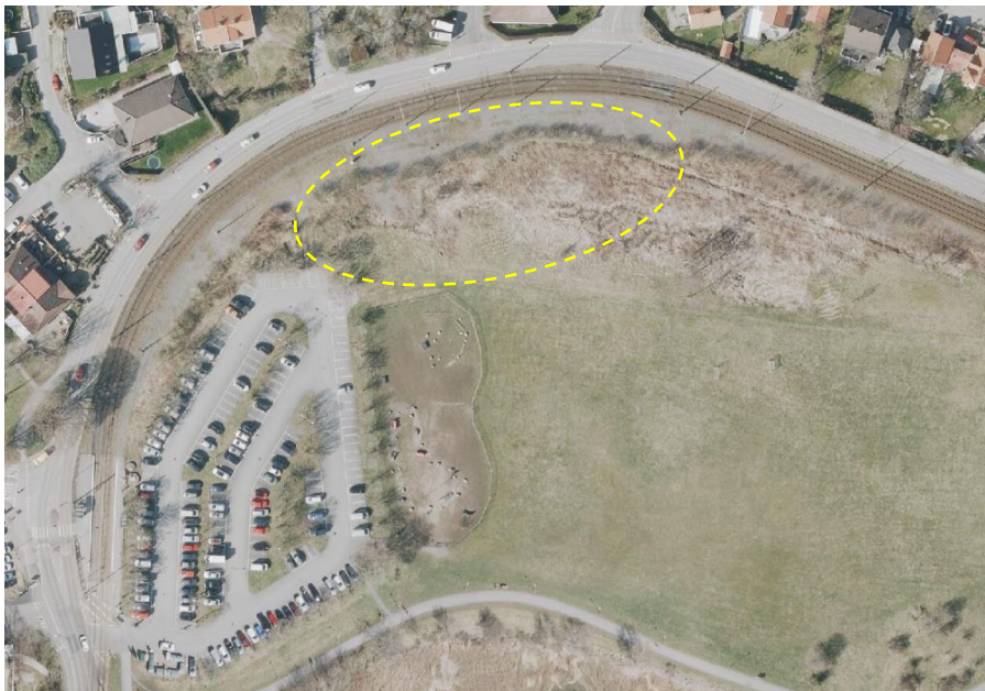
Figur 5. Befintlig parkeringsyta för besökare vid Vikebacken, med möjlighet till utbyggnad genom bygglovsansökan, se gul markering.

Idag tillhandahåller Parkeringsbolaget besöksparkeringar vid Vikebacken, där en ansökan om tillfälligt bygglov om utbyggnad avslogs av byggnadsnämnden 2020-06-23. Genom ett yrkande från D, M, L och S fick Parkeringsbolaget i uppdrag att komplettera ärendet genom att testa andra hårdgjorda ytor inom området. Parkeringsbolaget avser inkomma med en ny bygglovsansökan på ett mindre område (jämfört med tidigare ansökan) i anslutning till Vikebacken, se figur 5.