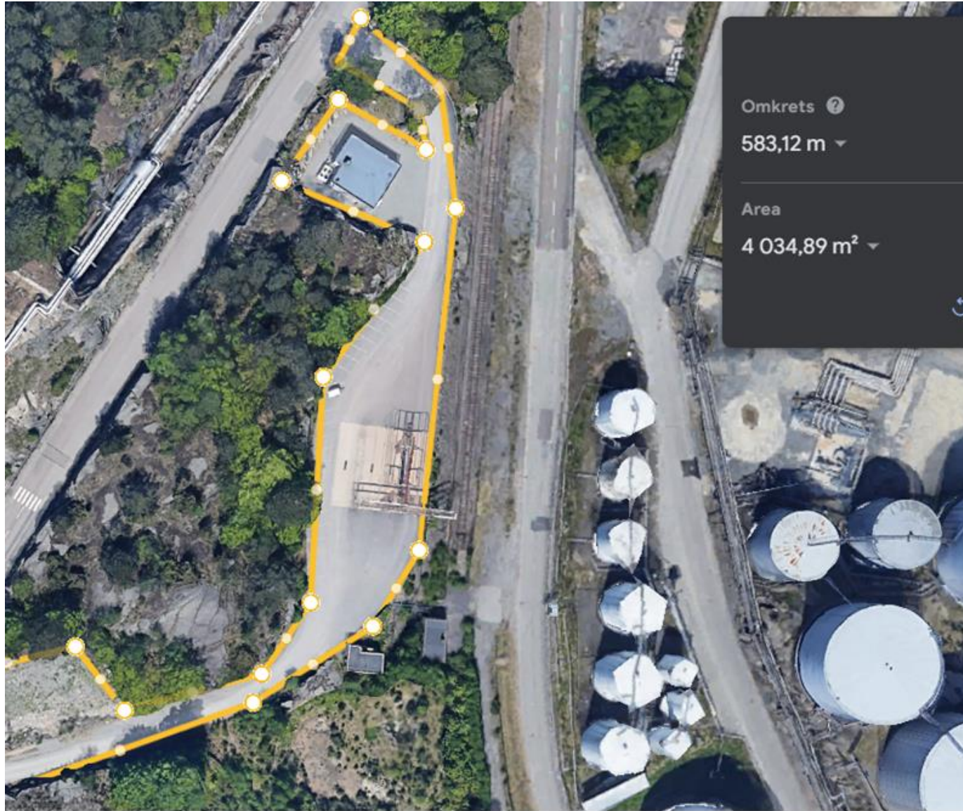
Bilaga 1: Berget Rya 2 vid gamla bränsleutlastningen och vid järnvägsspåret