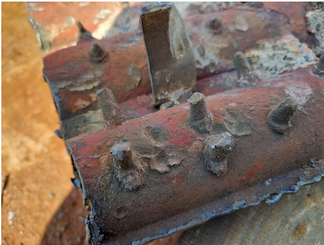
Detaljbild på skadade tuber under murbruk.