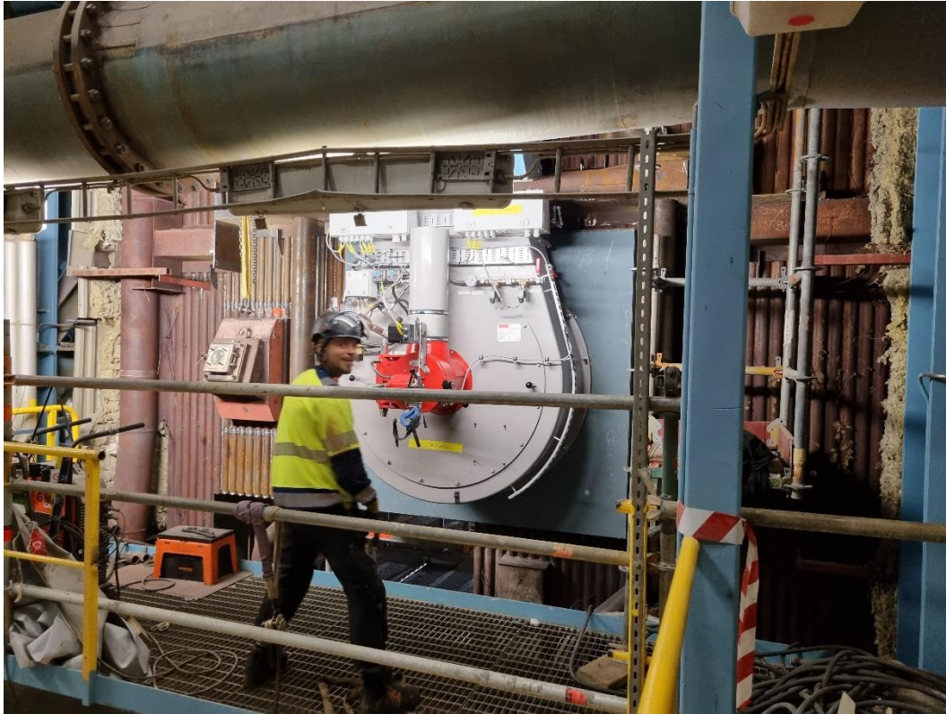
Ny brännare monteras. Glad entreprenör.