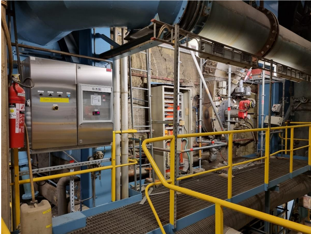
Gamla brännare. Elutrustning kvar. Isolering kvar. Plåt borttaget.