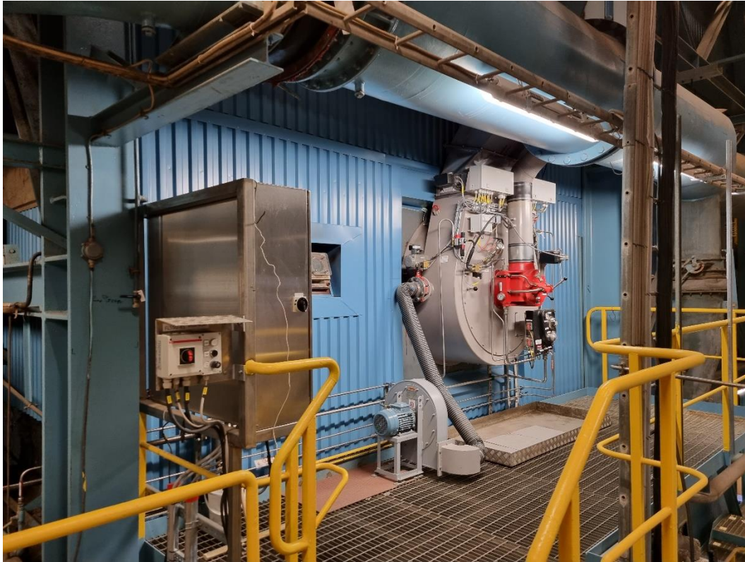
Installation brännare klar. Revision klar.