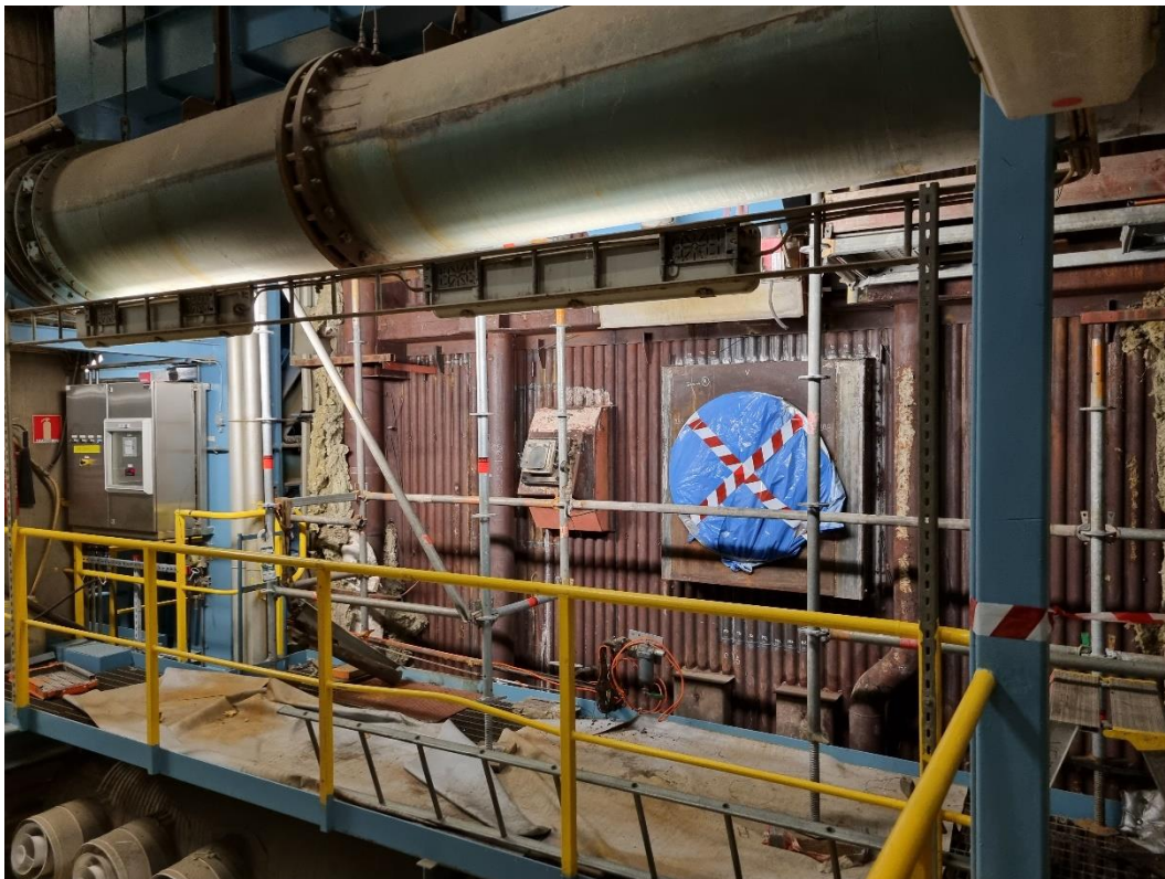
Undanböckning på plats.