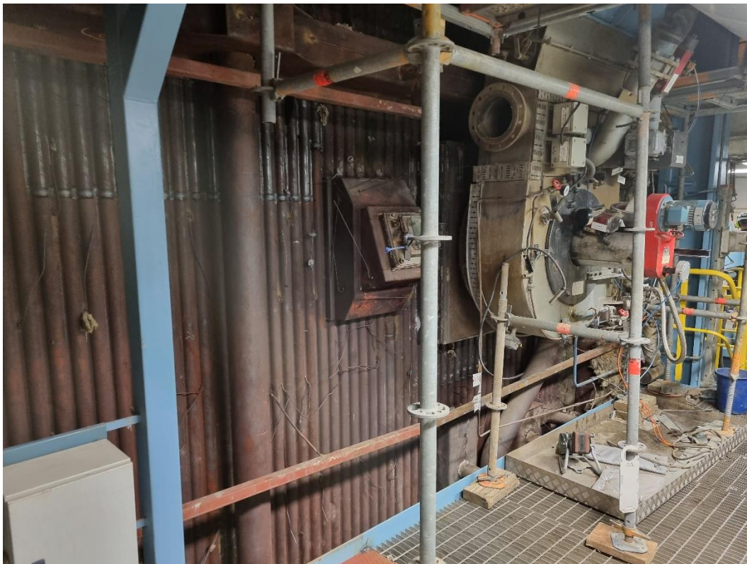
Gamla brännare. Avisolerad panna.