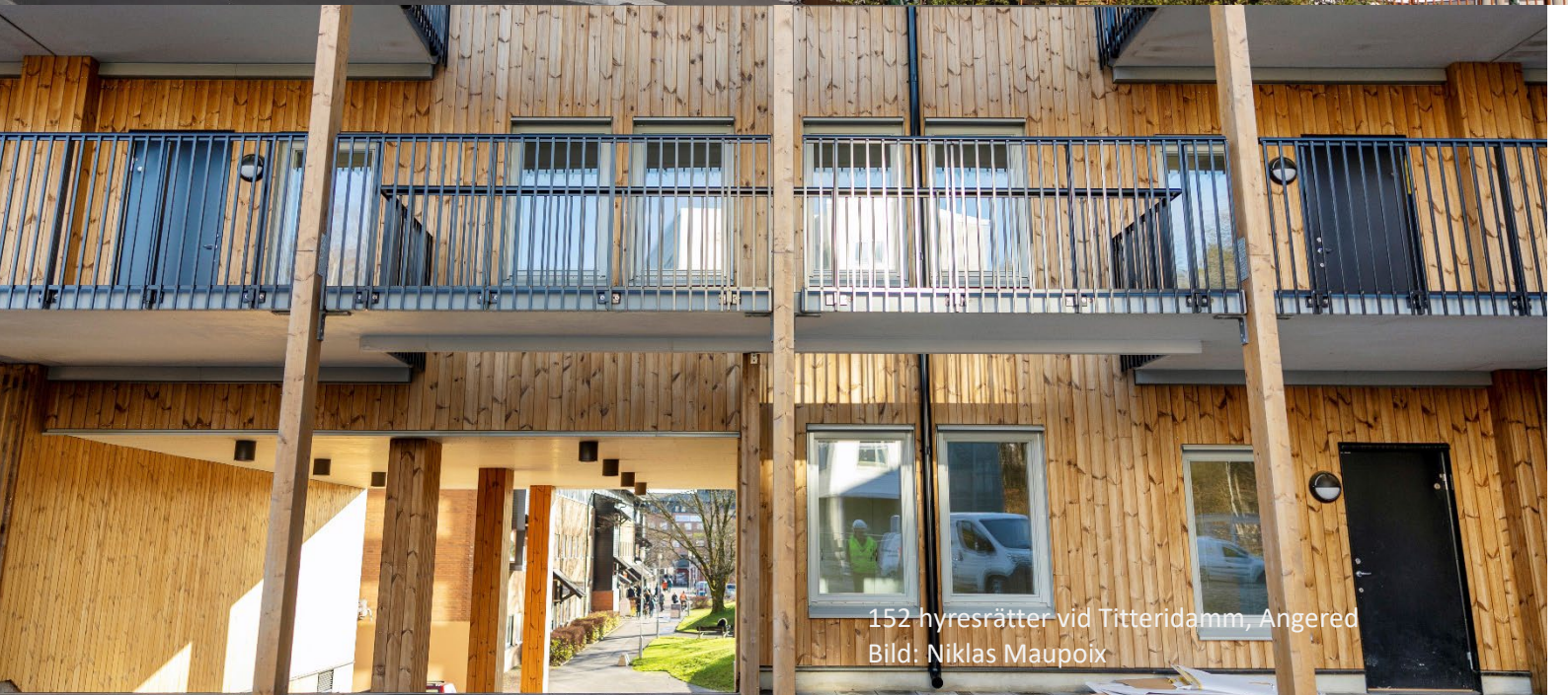
152 hyresrätter vid Titteridamm, Angered