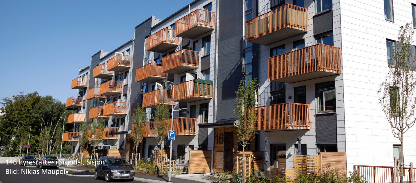
146 hyresrätter i Sisjodal, Sisjön