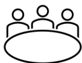
Arena för dialog och meningsskapande