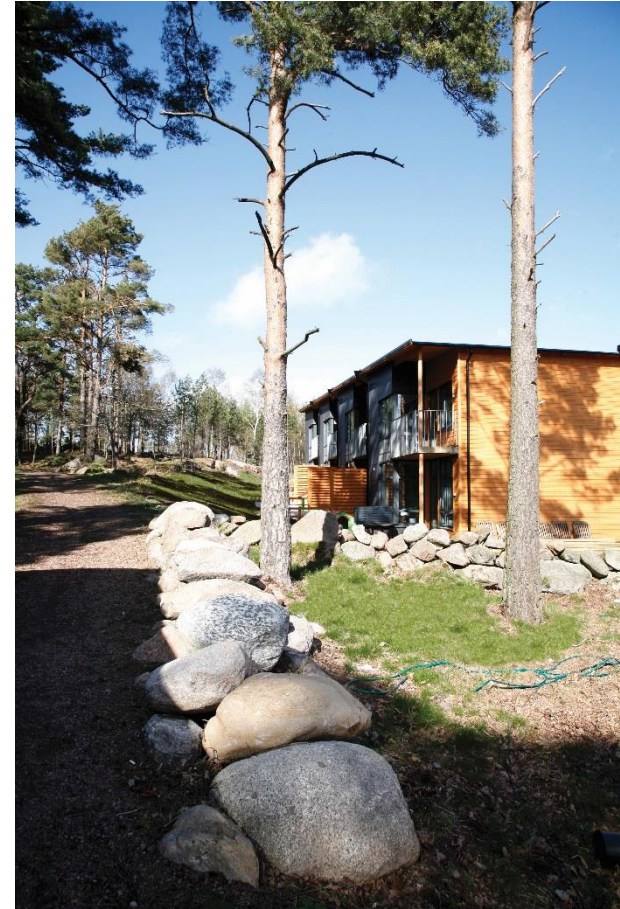
Båtsman Långs gata, Hisings Backa