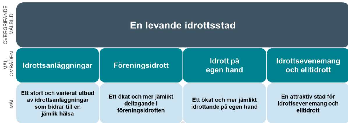
Figur. Programmets målstruktur.

Ett samordnat Göteborgs Stad som aktivt arbetar med alla delar av idrottspolitiken stärker Göteborgs roll som en levande idrottsstad och bidrar till en ökad fysisk aktivitet, en stärkt föreningsidrott och en jämlik hälsa.