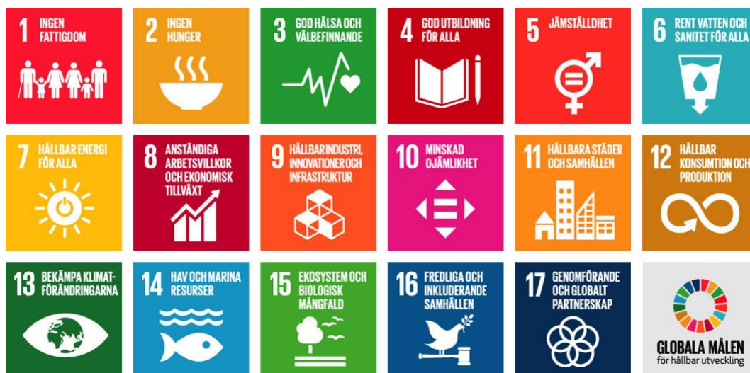
Figur. De 17 globala målen i Agenda 2030.

Eftersom det idrottspolitiska programmet spänner över många områden påverkar programmet ett större antal av de globala målen. Programmet bidrar med sina fyra mål framför allt till att uppfylla mål 1, 3, 5, 7, 8, 9, 10, 11 och 17.