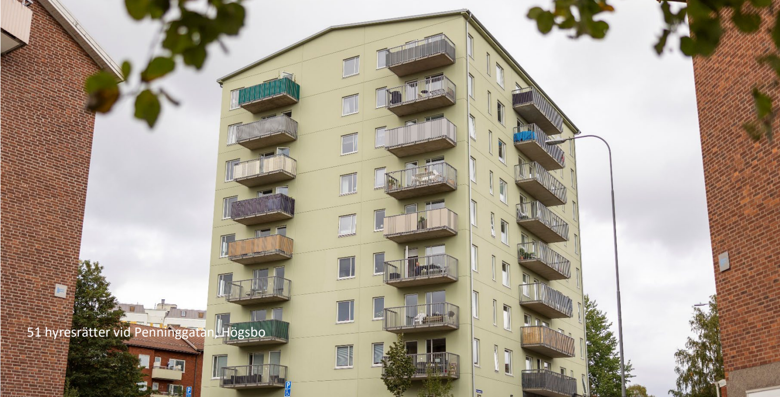
51 hyresrätter vid Penninggatan, Högsbo