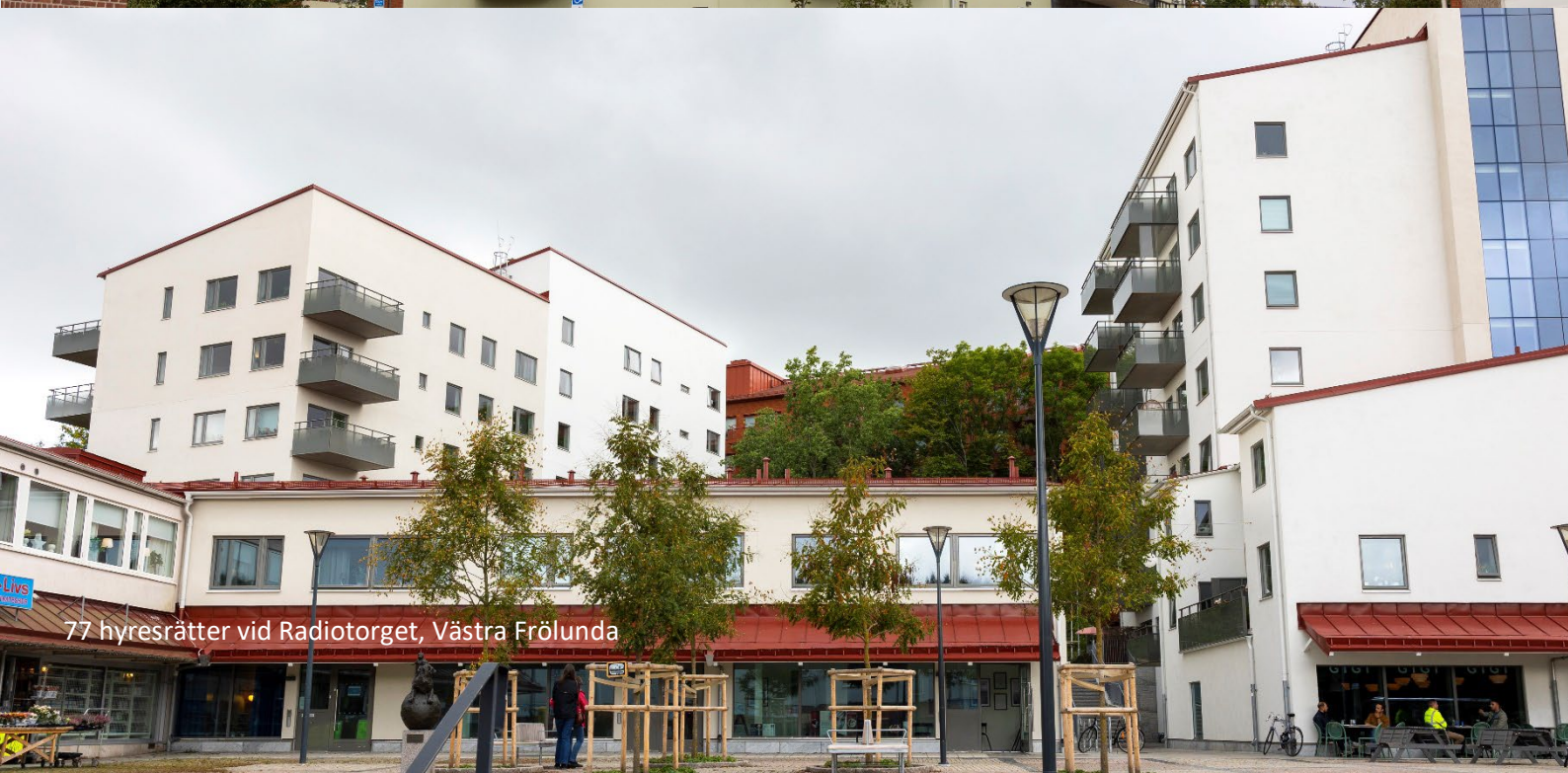
77 hyresrätter vid Radiotorget, Västra Frölunda