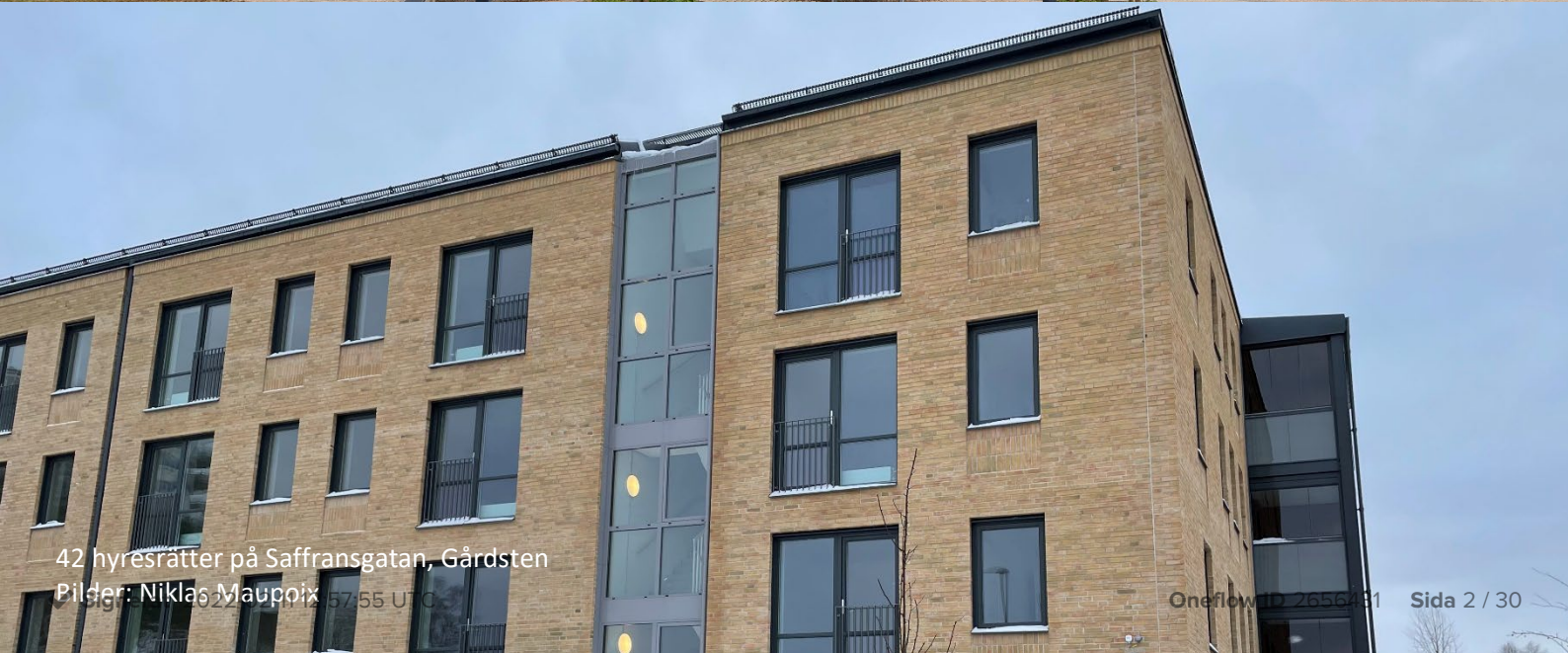
42 hyresrätter på Saffransgatan, Gårdsten