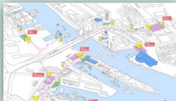
Prototyp Göteborg - staden som utställning 2 juni - 3 september