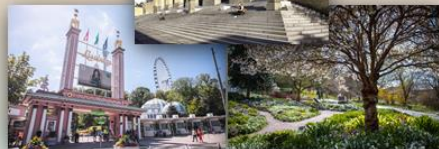
100 år i Göteborg