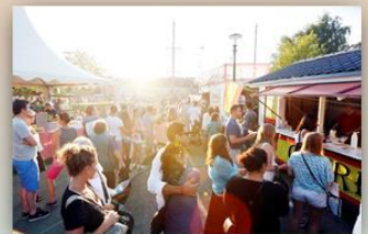
Göteborgs Kulturkalas, Frihamnsdagarna, Göteborgsvarvet Marathon med mera