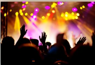
Göteborgs 400-årsfest 2 - 6 juni