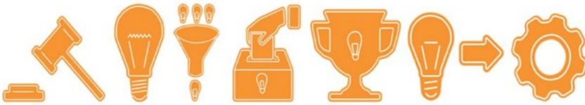
Bild 1. Process för medborgarbudget. Källa: SKL.

I denna skrift går vi igenom de olika faserna för medborgarbudget. Faserna är kortfattat dessa: