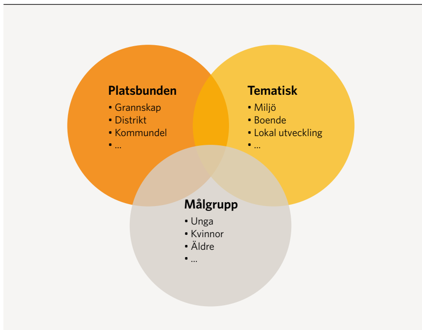
FIGUR 1. Medborgarbudgets tre inriktningar

Yves Cabannes visar att utvecklingen av medborgarbudget kan ses inom tre områden som förstås ibland går in i varandra. Politiska beslut styr idag främst vilket fokus medborgarbudgeten ska ha om den ska vara platsbunden där fokus är den geografiska ytan. Om medborgarbudgetens ska vara inriktad på olika teman där det finns ett särskilt behov av utveckling eller om den ska vända sig till särskilda grupper som inte vanligtvis deltar och som behöver ges särskild uppmärksamhet.