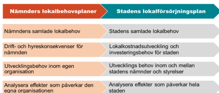
Figur 1. Kopplingen mellan stadens lokalförsörjningsplan och nämnders lokalbehovsplaner.

Syftet med nämnders lokalbehovsplaner är att ge nämnderna en tydlig struktur för och analys av nämndens lokalbehovsplanering, kopplade till behov och utmaningar. Det innebär att nämnden ska redogöra för lokalbehov av befintliga, tillkommande och avgående lokaler. Förutom att leverera en bild och analys till respektive nämnd utgör nämndernas lokalbehovsplaner också underlag till stadens övergripande lokalförsörjningsplan. Stadens nämnder, genom respektive förvaltning, ansvarar för processen att ta fram nämndens lokalbehovsplan.