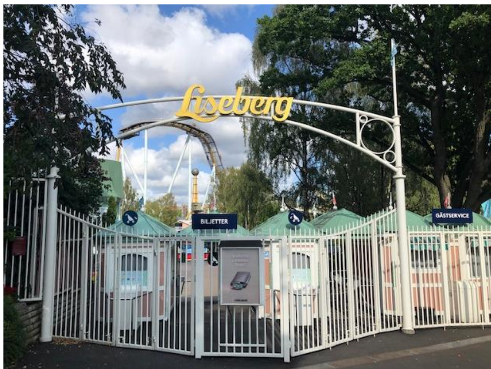
Bild 1. Befintliga Södra entrén

Ytan där Södra entrén och hotellet skall byggas är idag en viktig transportväg in och ut ur parken och även väg in för Räddningstjänsten.