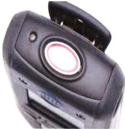
Bilaga 2. Guide för larm på handenheter