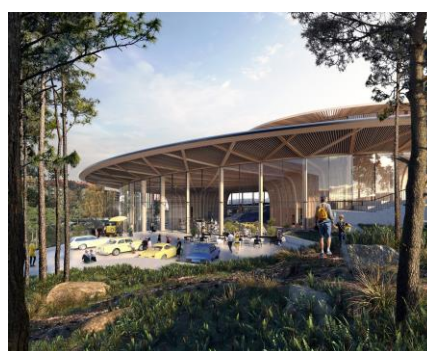
Volvo upplevelsecenter sett från sydöstra hörnet