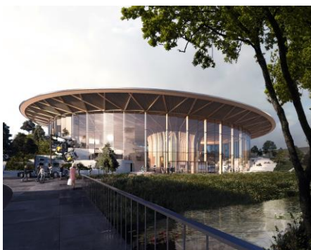
Volvo upplevelsecenter sett från Mölndalsån

Volvos upplevelsecenter, vilket är tänkt att bli en arkitektonisk byggnad i fyra plan med kringliggandepark, kommer att innebära förbättringar av kringmiljön och antas generellt öka besöksattraktiviteten till området och stärka stadens evenemangsstråk. Enligt Volvos beräkningar förväntas närmare 500 000 besökare till upplevelsecentret årligen, vilket därmed bidrar till att realisera kommunfullmäktiges beslutade besöksnärlingsprogram. En tredjedel av gästerna förväntas komma från närmarknaden (inom 2h resa), en tredjedel av svenskar från övriga landet och en tredjedel består av internationella besökare.