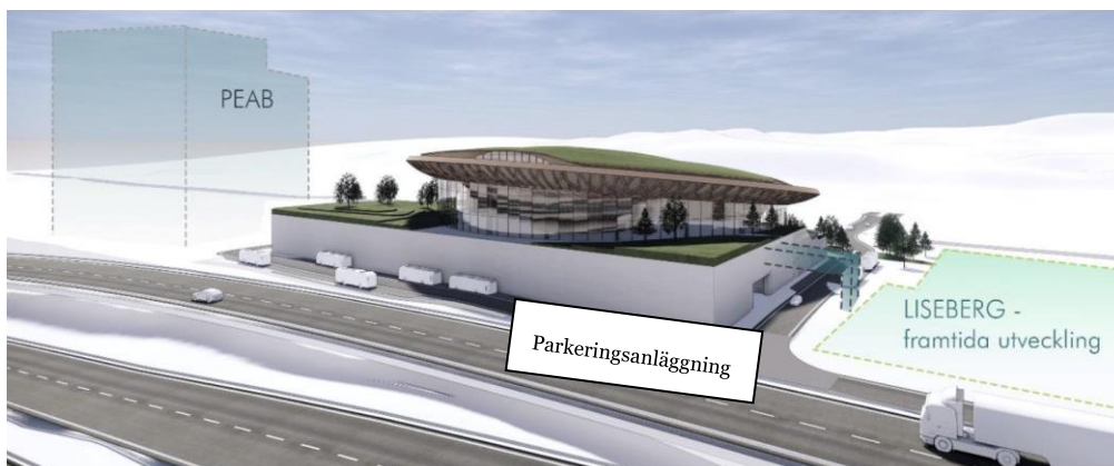
Volvo upplevelsecenter sett från E6/E20