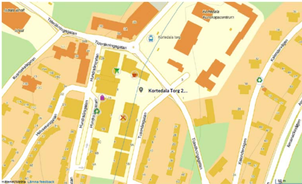
Situationsplan tagen från Eniro. Placering Kortedala torg 2 markerar Familjebostäders markanvisade fastighet Kortedala 134:7.

Huset byggs i 16 våningar varav första våningsplanet med entréplan mot Tusenårsgatan-Tideräkningsgatan. I souterrängplanet återfinns cykel och barnvagnsförvaring, återvinningsrum, teknikrum och en marklägenhet. På andra (som är entréplan från torget) samt tredje våningsplanen återfinns 11 stycken BmSS lägenheter. På andra våningsplanet finns även två stycken tvättstugor. Våningsplan 4 till och med 15 är normalplan med 5 stycken lägenheter per våningsplan fördelade på två 3:or, en 2:a samt två 1:or. Våningsplan 16 innefattar tre stycken lägenheter, teknikrum samt en terrass som kan nyttjas av de boende från hela huset.