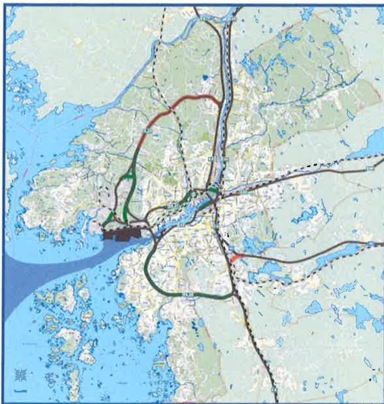
Figur 3. För att undvika trafik genom centrala Göteborg behöver lederna runt staden förstärkas, vilket hamnen också framfört till Trafikverket.

Enligt lastbilsundersökningen kommer omkring 15–20 procent av hamnens trafik från E6N. Av dessa kör endast 3 av 10 Hisingsleden/Norrleden, medan 7 av 10 kör via Lundbyleden. Samtidigt är Hisingsleden/Norrleden viktig för transporter med farligt gods. Lastbilar som kommer från söder och öster och ska till hamnen bör av samma orsaker som ovan välja Söderleden, Västerleden och Älvsborgsbron istället för Kungsbackaleden (E6) förbi Gårda och vidare Lundbyleden alternativt Oscarsleden (E45).