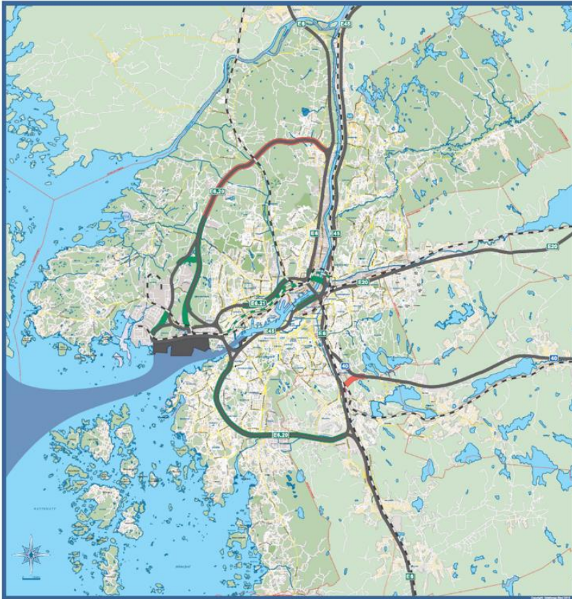
Figur 3. För att undvika trafik genom centrala Göteborg behöver lederna runt staden förstärkas, vilket hamnen också framfört till Trafikverket.

Enligt lastbilsundersökningen kommer omkring 15–20 procent av hamnens trafik från E6N. Av dessa kör endast 3 av 10 Hisingsleden/Norrleden, medan 7 av 10 kör via Lundbyleden. Samtidigt är Hisingsleden/Norrleden viktig för transporter med farligt gods. Lastbilar som kommer från söder och öster och ska till hamnen bör av samma orsaker som ovan välja Söderleden, Västerleden och Älvsborgsbron istället för Kungsbackaleden (E6) förbi Gårda och vidare Lundbyleden alternativt Oscarsleden (E45).