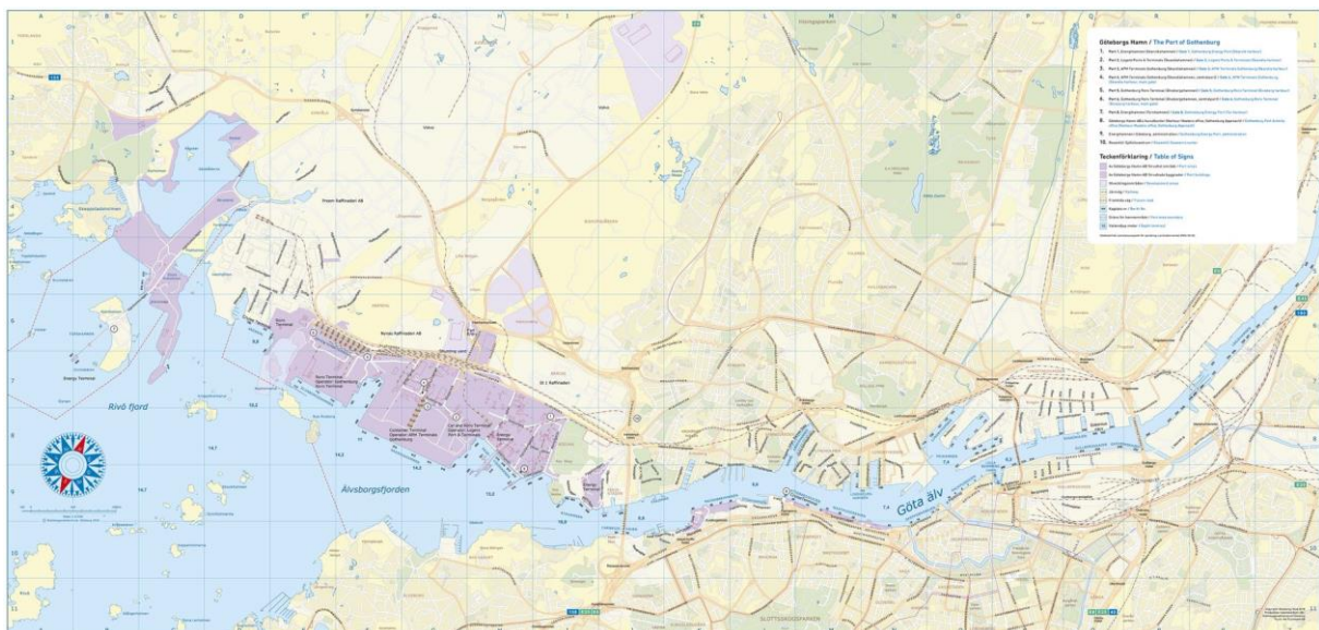
Figur 1. Göteborgs hamns verksamhet är spridd över flera olika geografiska delar och innefattar ett flertal olika terminaloperatörer. Det är därför inte självklart att definiera ”hamnen” som en enskild geografisk plats.

Göteborgsregionen har en hög andel tung trafik längs huvudvägnätet i jämförelse med andra regioner. Huvudanledningarna till detta är behoven som finns hos industrierna och logistikföretagen som finns i och kring regionen, transittrafik mellan Norge och kontinenten samt trafik till och från Göteborgs Hamn.