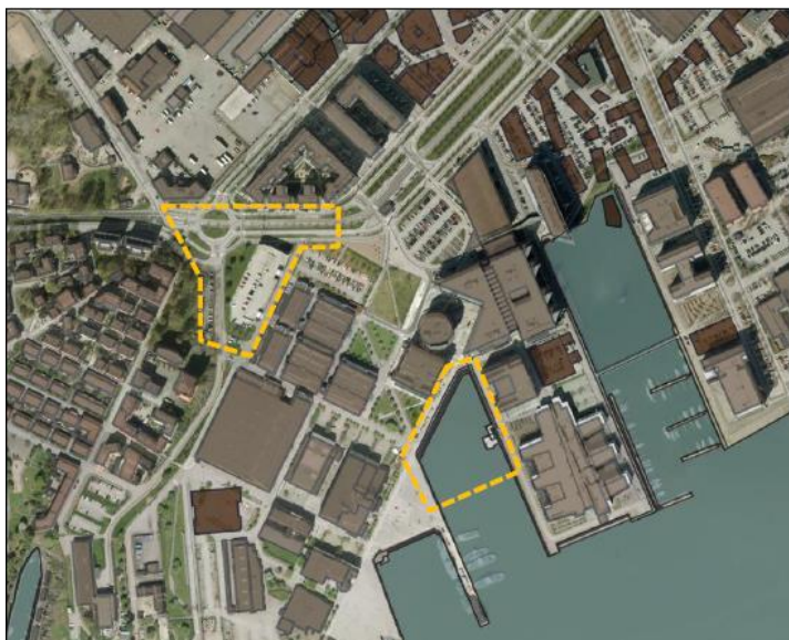
Figur 2. Planområdet för stationen och tornet i nuläget, samt med planerade byggnader i antagna planer

Området runt stationen innehåller en större andel kontor och verksamheter än bostäder och bedöms ha ett relativt bra utbud av kommersiell service.