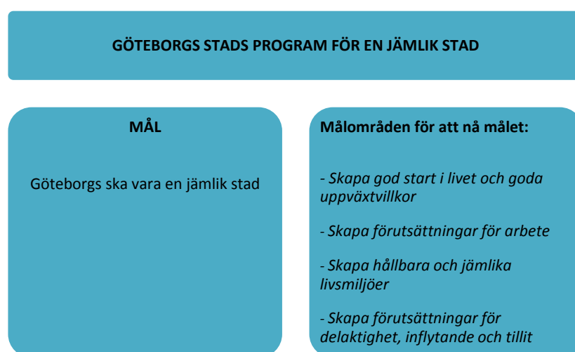
Figur 2 Programmets övergripande struktur

Detta program inleds med en beskrivning av målet med Göteborgs Stads jämlikhetsarbete. Därefter beskrivs var och ett av de fyra målområdena som stadens jämlikhetsarbete kommer fokusera på för att uppnå målet. Efter beskrivningen av varje målområde följer strategier som är av betydelse för arbetet. Varje målområde har mellan fem och sju strategier som anger fokus för arbetet.