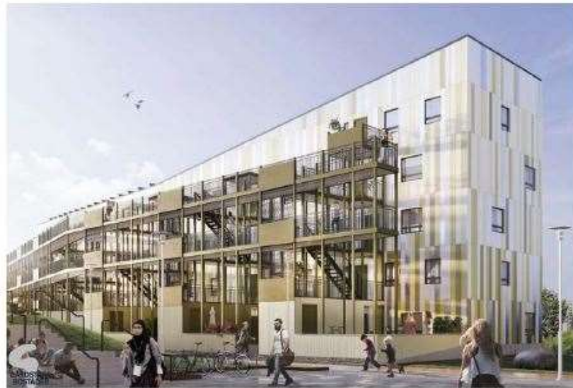
Skiss Generationsboendet i Gårdsten