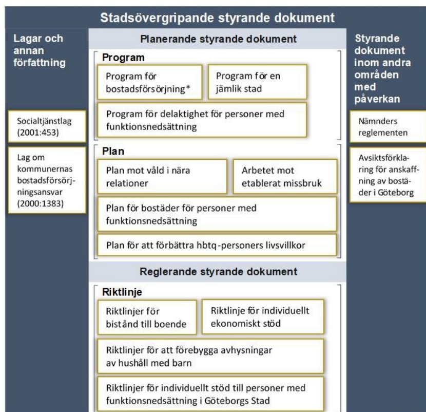
Figur 1 - Styrande dokument som angränsar till hemlöshetsplan 2020–2022

Figuren visar program, planer och riktlinjer som angränsar till hemlöshetsplanen.