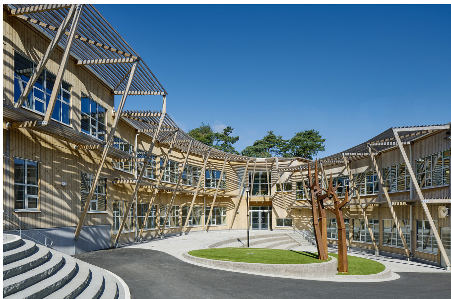
Landamäreskolan i Norra Biskopsgården.