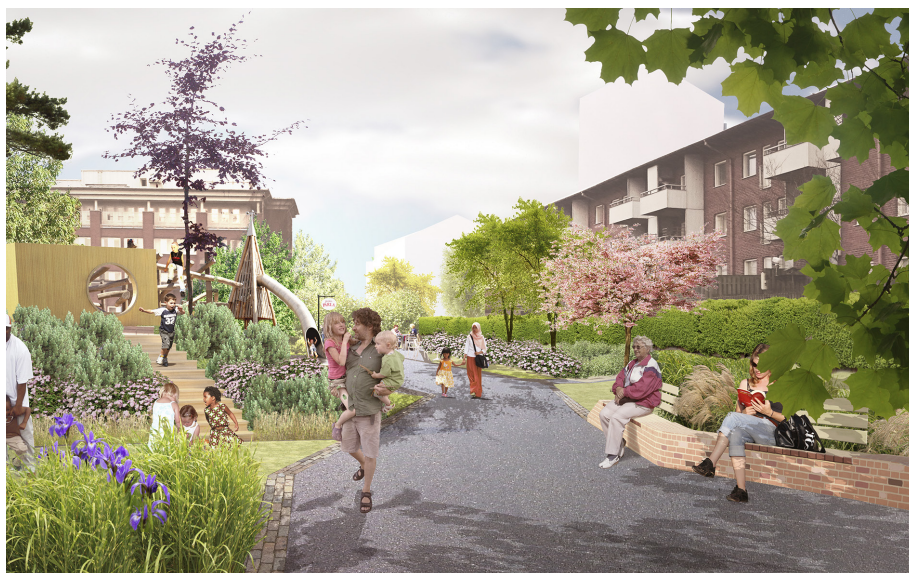
Selma Lagerlöfs parkstråk, ny park i gammal, fast omvandlad stadsdel. ÄWL arkitekter ritade efter tävlingsvinst.