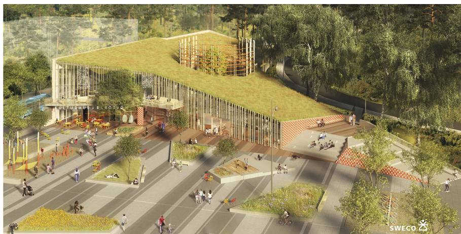
Det nya kulturhuset i Bergsjön bildar fond till huvudstråket och skapar det nya Rymdtorget.

Arkitektur handlar om att skapa värden för det omgivande samhället och framtida generationer. Göteborgs identitet, dess historiska arv och dess unika tillgång till kust och stadsnära naturmiljöer ska ligga till grund för stadens fortsatta utveckling.