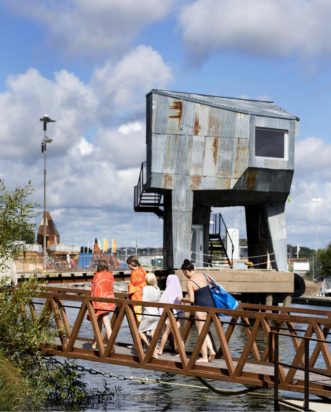
Bastun i Jubileumsparken, tillfällig arkitektur som vi gärna ser permanentas, tillkommen i samarbete med göteborgarna. Arkitekt Raumlabor Berlin.