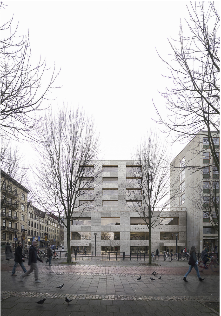
Handelshögskolan byggs till med ny byggnad efter tävlingsvinst för Johannes Norlander. BILD: JOHANNES NORLANDER ARKITEKTUR