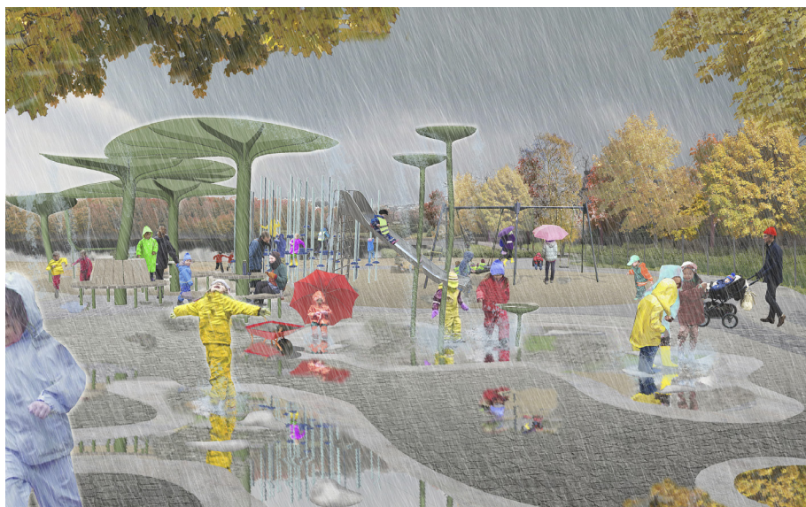
En ny regnlekplats vid Näckrosdammen, ett projekt i Jubileumssatsningen Rain Gothenburg.